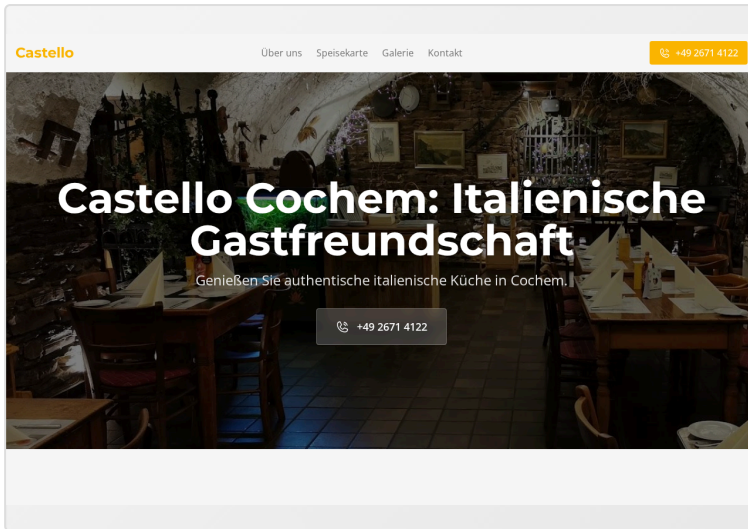
Ansicht am Computer

Scannen Sie den QR-Code und überzeugen Sie sich selbst – direkt auf Ihrem Smartphone