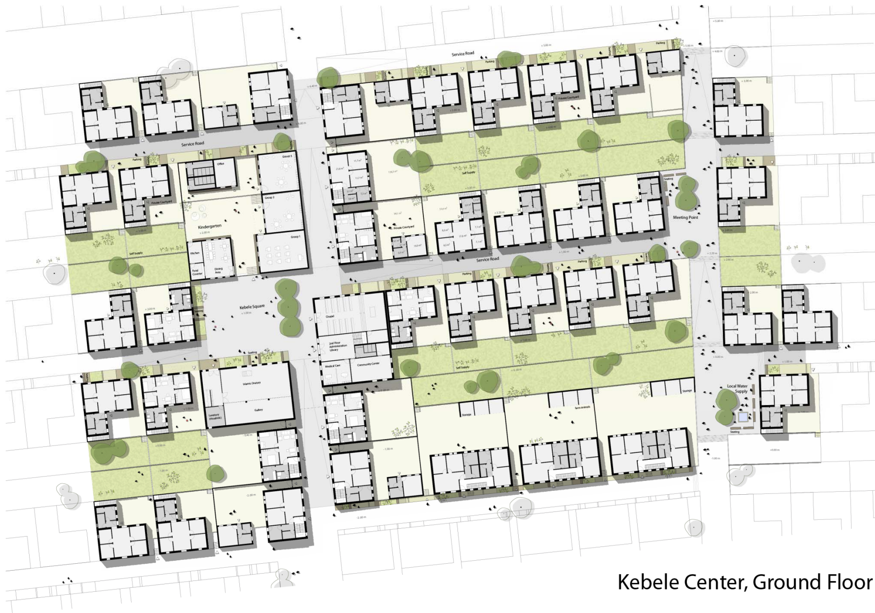
Kebele Center, Ground Floor