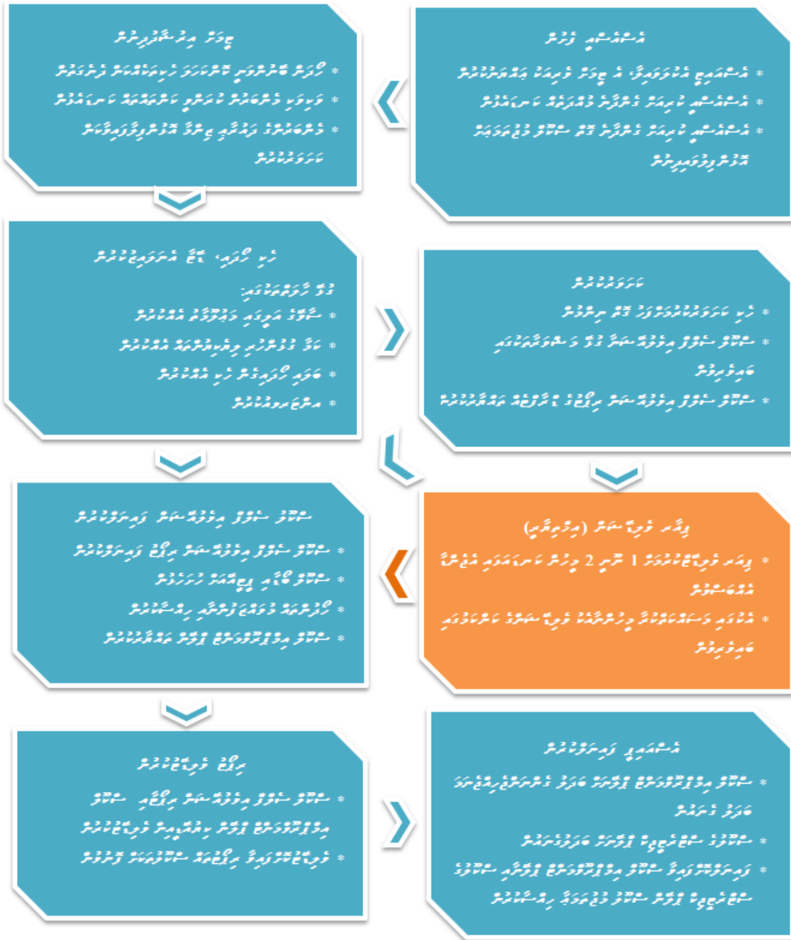
نومۇرى 5: سوت سوتۇم مەھكىمىسى ئىسپات سىستېمىسىنى تەشكىل قىلىش