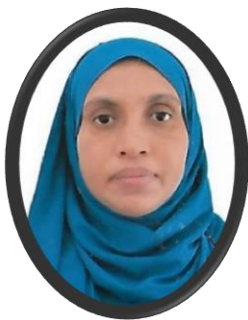
مەسئۇل ۋاسىئەت تەرتىپى نازرسونو تەسىر ۋە ئۆزگەرتىش قانۇنى