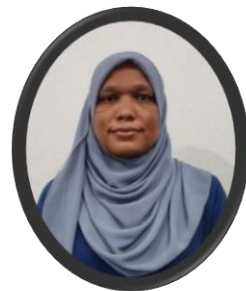
مەسئۇل رەھبەرلىك قىلىدۇ نازرسونو تەسىر ۋە ئۆزگەرتىش قانۇنى