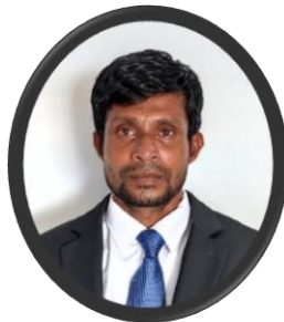
ۋاسىئەت تەرتىپى نازرسونو نازرسونو تەسىر ۋە ئۆزگەرتىش قانۇنى