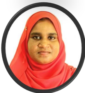
مەسئۇل رەھبەرلىك قىلىدۇ نازرسونو تەسىر ۋە ئۆزگەرتىش قانۇنى