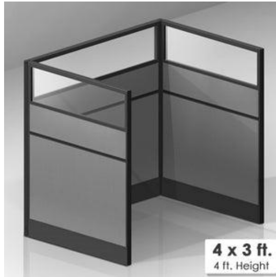
جے ڈی آر 03: سرڈیس