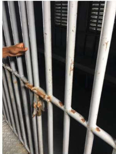
6. 1 ވަނަ ބައިގެ 1 ވަނަ ބައިގެ 1 ވަނަ ބައި