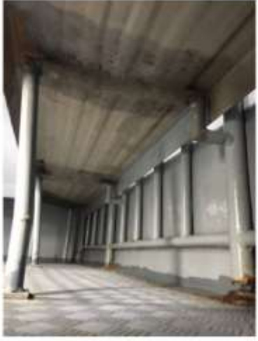
1. ސަރުކާރުގެ ގެޒެޓް ގައި ބަޔާންކުރި ޕްރޮޖެކްޓްގެ ސަރުކާރުގެ ބޭނުން ޖެހޭ ގޮތުން