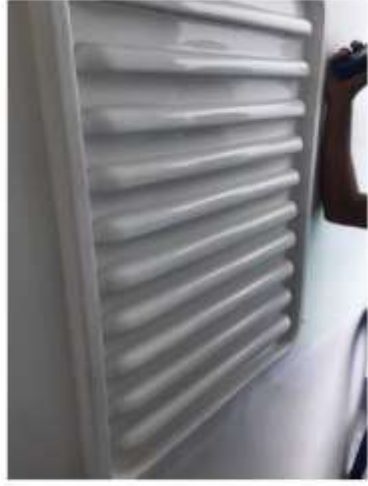
2. ޕްރޮޖެކްޓްގެ ސަރުކާރުގެ ބޭނުން ޖެހޭ ގޮތުން