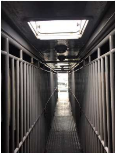
5. 5 ވަނަ ބައިގެ 1 ވަނަ ބައިގެ 1 ވަނަ ބައި