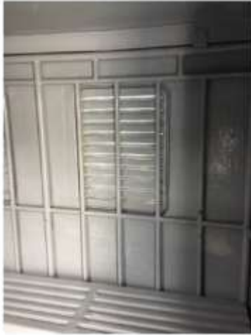
4. ސަރުކާރުގެ ގަވާއިދުގެ 1 ވަނަ ބައިގެ 1 ވަނަ ބައި