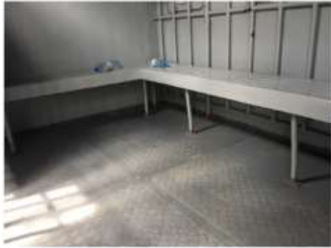
3. 3 ވަނަ ބައިގެ 1 ވަނަ ބައިގެ 1 ވަނަ ބައި