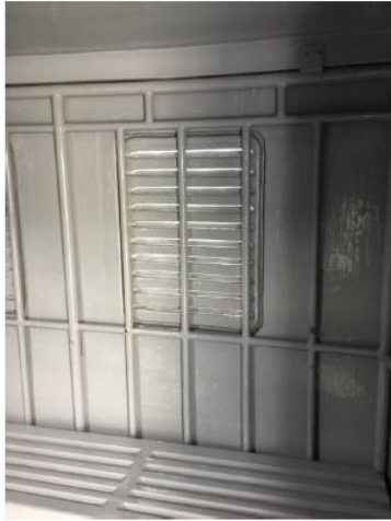
4. ශාලාවේ පිහිටි පුද්ගලික භාණ්ඩ 1 වැනි වැනි පුද්ගලික භාණ්ඩ