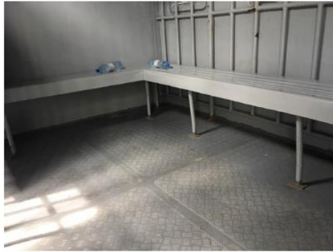
3. පුද්ගලික භාණ්ඩ පුද්ගලික භාණ්ඩ පුද්ගලික භාණ්ඩ