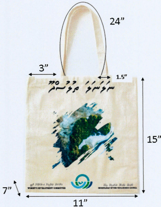
5.3 ޖުލުސާރު ޖުލުސާރު

5.3.1 ޖުލުސާރު ޖުލުސާރު ޖުލުސާރު ޖުލުސާރު ޖުލުސާރު ޖުލުސާރު ޖުލުސާރު ޖުލުސާރު