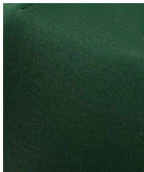
Pantone 364C - Green