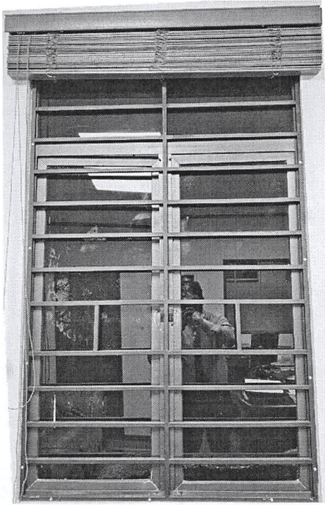
Figure 1: Sample of the safety grill.