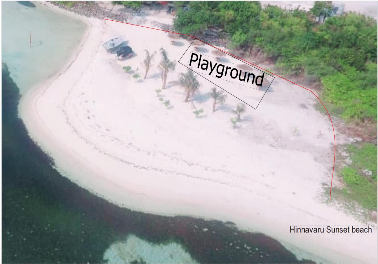
Hinnavaru Sunset beach