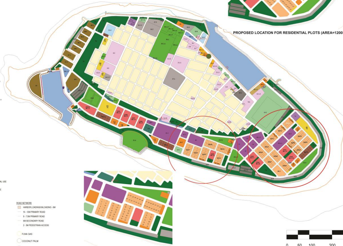
PROPOSED LOCATION FOR RESIDENTIAL PLOTS (AREA=1200SQFT OF 83 PLOTS)