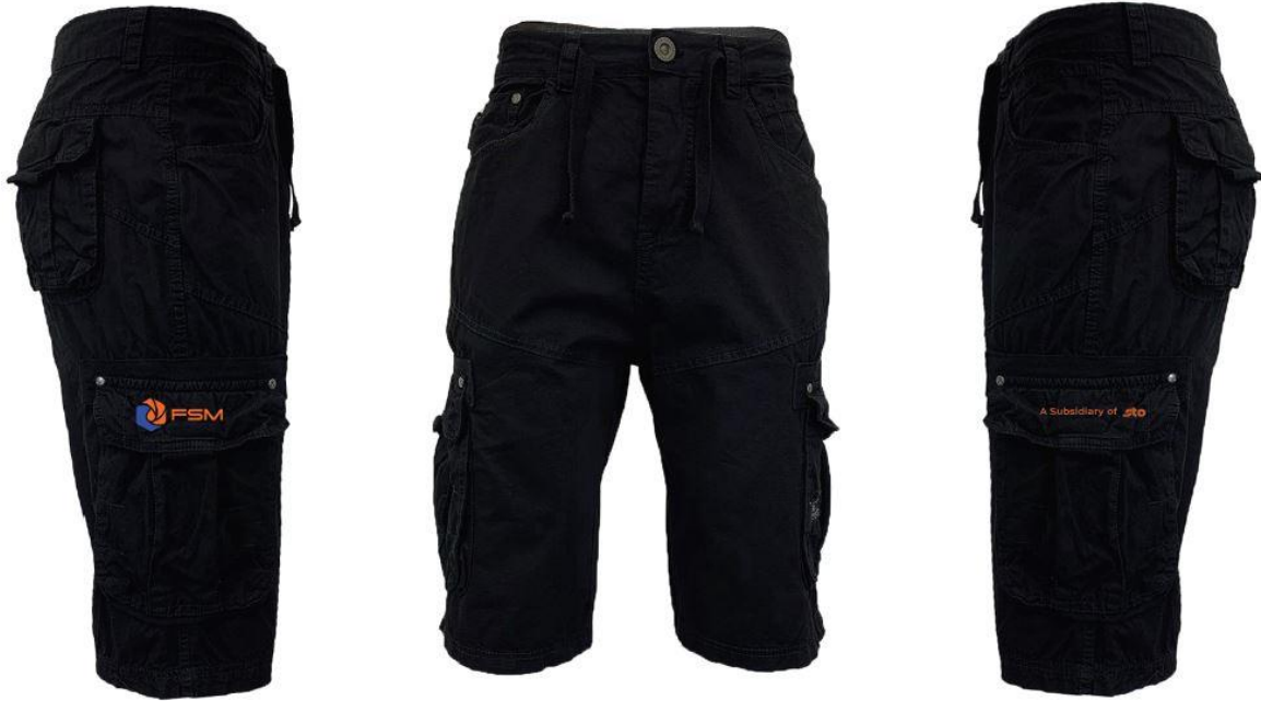
Side Pocket on the Right (embroidery)