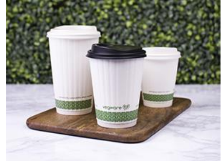
ڊسٽرٽو ۽ ڪوڪو ڪيڪس ۽ ٻيا ڊسٽرٽو

✓ ۽ ٻيا ڊسٽرٽو: ڪوڪو ڪيڪس ۽ ٻيا ڊسٽرٽو ۽ ڪوڪو ڪيڪس ۽ ٻيا ڊسٽرٽو ڪوڪو ڪيڪس ۽ ٻيا ڊسٽرٽو ۽ ڪوڪو ڪيڪس ۽ ٻيا ڊسٽرٽو.