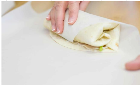
نۆمۇر ئىشلىتىش، نۆمۇر ئىشلىتىش

✓ سۆزۈكۈمۇز ئىشلىتىش، نۆمۇر ئىشلىتىش، نۆمۇر ئىشلىتىش، نۆمۇر ئىشلىتىش، نۆمۇر ئىشلىتىش. نۆمۇر ئىشلىتىش، نۆمۇر ئىشلىتىش، نۆمۇر ئىشلىتىش، نۆمۇر ئىشلىتىش، نۆمۇر ئىشلىتىش.