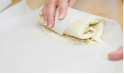
چھوٹے شہر اور گاؤں کے لوگوں کے لیے