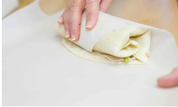
ساخته های سرد

✓ نکته: برای جلوگیری از خراب شدن سوسیس و مرغی جگر مرغی، بهتر است آن را در یخچال نگهداری کنید.