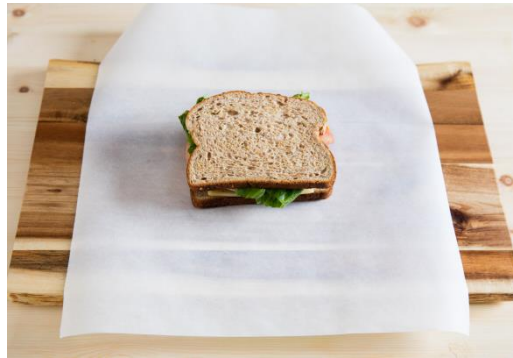
ساخته های سرد

✓ نکته: برای جلوگیری از خراب شدن سوسیس و مرغی جگر مرغی، بهتر است آن را در یخچال نگهداری کنید.