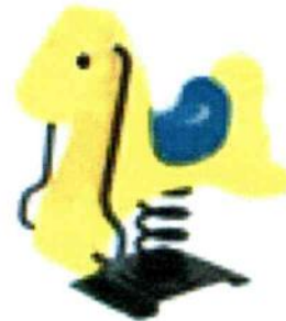
Material: Plastic LLDPE Size: 80cmX60cmX80cm