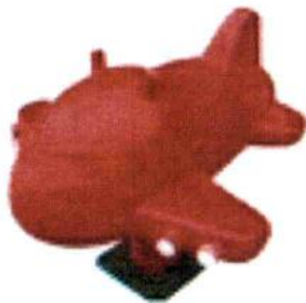
Material: Plastic LLDPE Size: 96cmX96cmX78cm