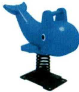
Material: Plastic LLDPE Size: 88cmX48cmX88cm