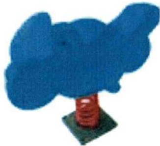
Material: Plastic LLDPE Size: 85cmX50cmX98cm