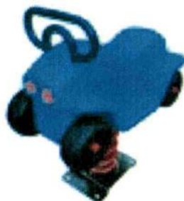
Material: Plastic LLDPE Size: 88cmX48cmX80cm