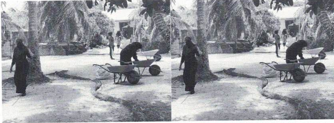
بىر تەرەپلىك سۈپەت ئۆلچىمى رىپورتىدا بىر تەرەپلىك سۈپەت ئۆلچىمى

بىر تەرەپلىك سۈپەت ئۆلچىمى رىپورتىدا بىر تەرەپلىك سۈپەت ئۆلچىمى 16-نومۇر 2021-يىلى ئىشلىرىنىڭ ئىشەنچلىك رىپورتىدا بىر تەرەپلىك سۈپەت ئۆلچىمى رىپورتىدا بىر تەرەپلىك سۈپەت ئۆلچىمى 5,240.00 رىپورتىدا بىر تەرەپلىك سۈپەت ئۆلچىمى رىپورتىدا بىر تەرەپلىك سۈپەت ئۆلچىمى