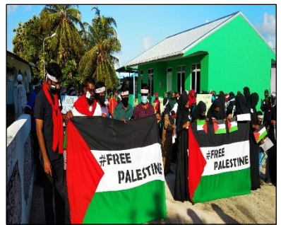
قوسوسو مريج ارتر لاريسوسون رسري ركرناكوسون كوسوسو مريج ارتر لاريسوسون رسري ركرناكوسون كوسوسو مريج.