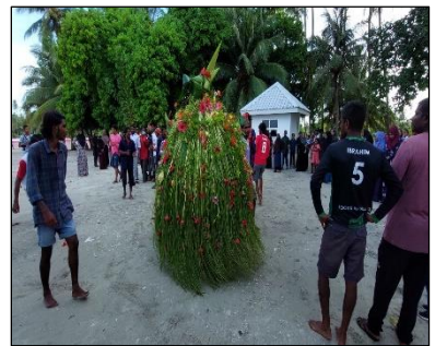
1442 قوس ارتر لاريسوسون رسري ركرناكوسون كوسوسو مريج ارتر لاريسوسون رسري ركرناكوسون كوسوسو مريج.

قوسوسو مريج ارتر لاريسوسون رسري ركرناكوسون كوسوسو مريج ارتر لاريسوسون رسري ركرناكوسون كوسوسو مريج.