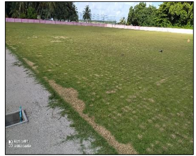
ارتر كوسوسو مريج ارتر لاريسوسون رسري ركرناكوسون كوسوسو مريج ارتر لاريسوسون رسري ركرناكوسون كوسوسو مريج.