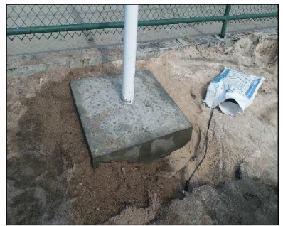
ارتر كوسوسو مريج ارتر لاريسوسون رسري ركرناكوسون كوسوسو مريج ارتر لاريسوسون رسري ركرناكوسون كوسوسو مريج.