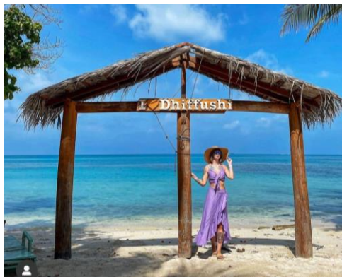
3.1 ފަނުދޯ ބަނުދޯ