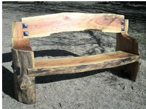
4.1 ފަނުދޯ ބަނުދޯ ބަނުދޯ