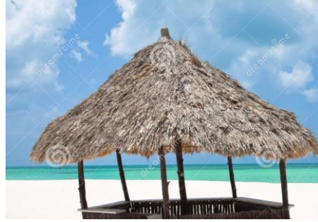
1.1 ފަނުދޯ (ބަނުދޯ)