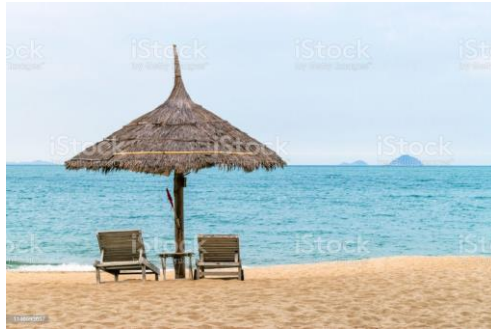
2.1 ފަނުދޯ (ނަނުދޯ)