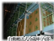
自動搬送式冷蔵庫(内部)