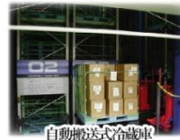
自動搬送式冷蔵庫 (搬入部分)

緑茶製造仕上ライン (3000kg/日)1ライン ギャバロン茶製造ライン (3000kg/日)2ライン ギフト用缶製造ライン (1200本/日)1ライン 全自動袋詰ライン (10000本/日)2ライン 小口対応袋詰機 (5000本/日)2機 大型窒素置換機 (6000kg/日)2機 全自動窒素置換機 (5000kg/1機)1機 大型合組機 (4000kg/1機)2機 (3000kg/1機)1機 小型合組機 (300kg/1機)1機 (100kg/1機)1機 自動搬送式冷蔵庫 (総数量 700,000kg)1室 釜炒茶製造施設 (100kg/日)1機