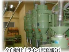
全自動仕上ライン(店賃部分)