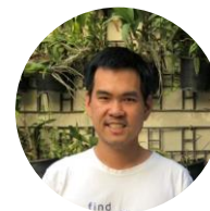
Seksith T. COO & Co-founder

Engineer at Qbic Group Part-time at USA Bar B Q Plaza