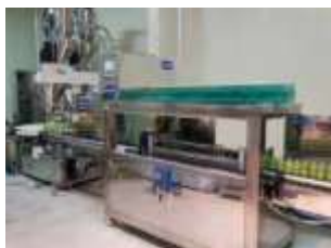
보틀생산라인 Bottle Production Line