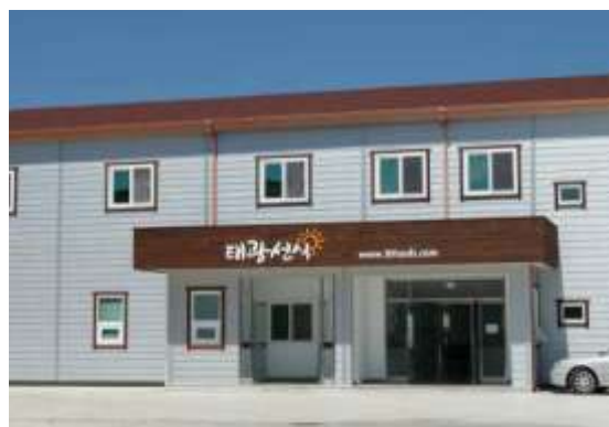
사무동 Office building

is the second plant of Taekwang Food Co., Ltd., located in Sangju, Gyeongsangbuk-do, which produces bottle-type grain powder and pouch packaging products. It has the best high-tech production facilities in Korea and has been established in accordance with HACCP standards from factory design. Production facilities without windows produce the safest food by fundamentally blocking foreign substances from outside. 50,000 bottle products can be produced per day and 3,000 tons of products per year. In particular, by establishing the industry's first bottle grain line, we have created an environment where customers can drink grain more comfortably.