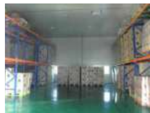
창고 내부 Inside of Warehouse