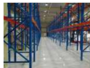
물류창고 Logistics warehouse