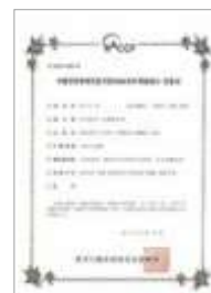
HACCP 기타가공품 HACCP Other processed products