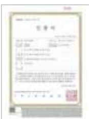
유기농 인증서 Organic certificate