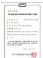
HACCP 즉석섭취식품 HACCP Instant food