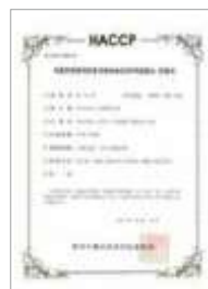
HACCP 두류가공품 HACCP Processed beans products