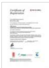
FSSC22000 인증서 Food safety ISO 22000