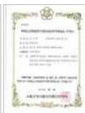
HACCP 기타가공품 HACCP Other processed products