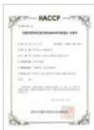
HACCP 곡류가공품 HACCP Grain processed products