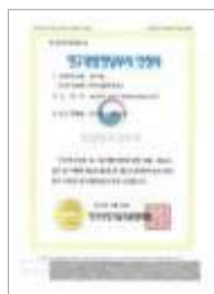
연구전담부서 Certificate of R&D Department