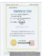
연구전담부서 Certificate of R&D Department