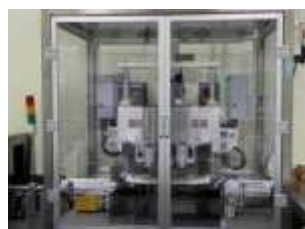
그래놀라 생산라인 Granola production line