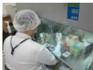
R&D 연구실 R&D lab.