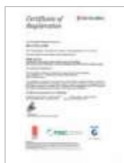
FSSC22000 인증서 Food safety ISO 22000