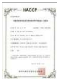
HACCP 즉석섭취식품 HACCP Instant food