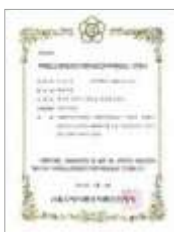
HACCP 곡류가공품 HACCP Grain processed products