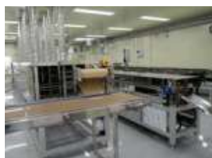
누룽지 생산라인 Nurungi production line

We are striving to develop new natural health products in certified research facilities, and with the belief that family members, not others, eat them. It produces safe and hygienic products.