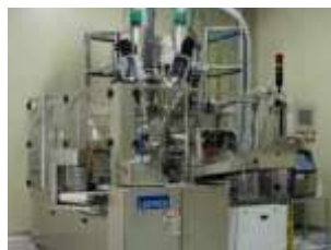
파우치 장비 Pouch Equipment