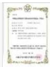
HACCP 두류가공품 HACCP Processed beans products