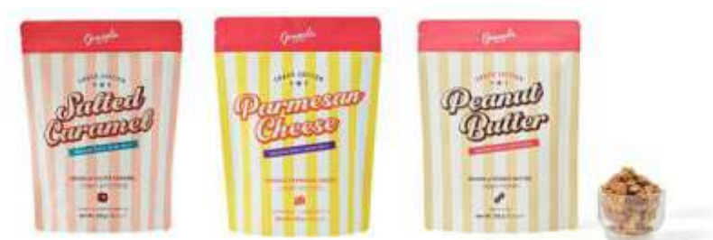
솔티 카라멜 salty caramel