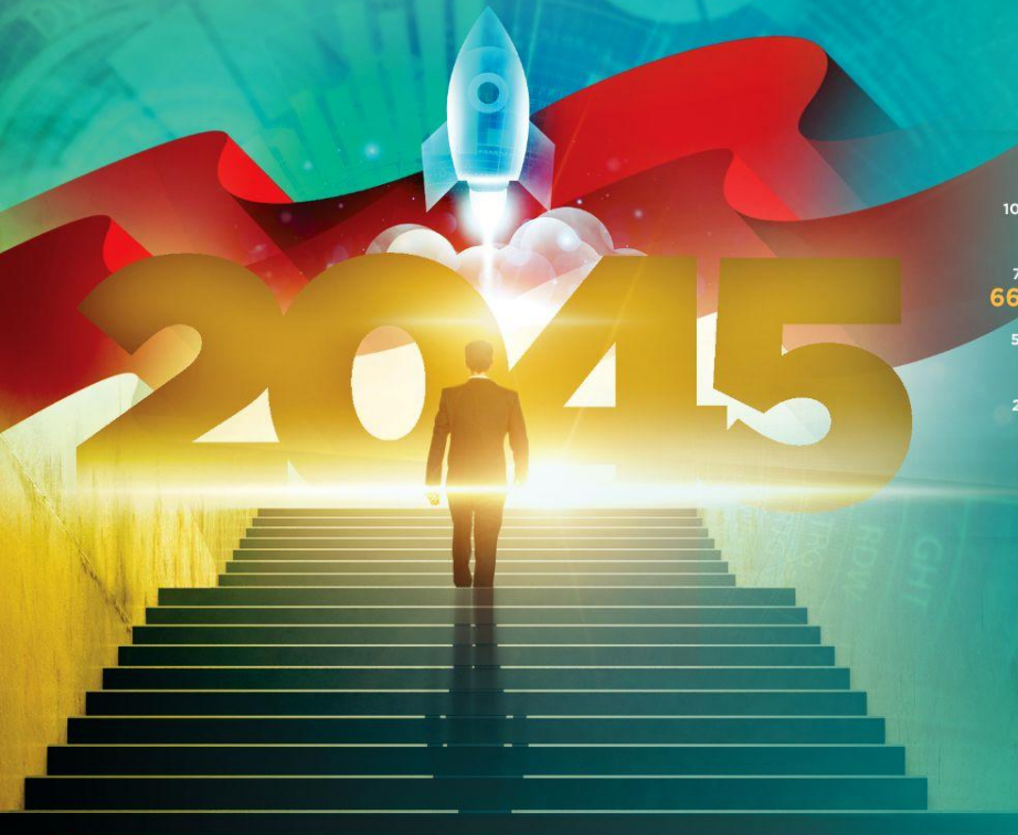
Jumlah UMKM menuju Indonesia Emas 2045