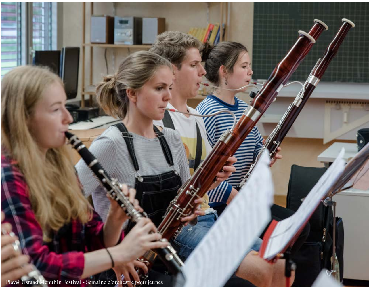
Play@ Gstaad Menuhin Festival - Semaine d'orchestre pour jeunes