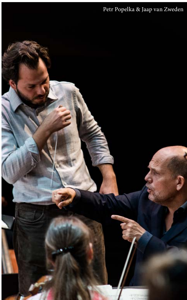
Petr Popelka & Jaap van Zweden