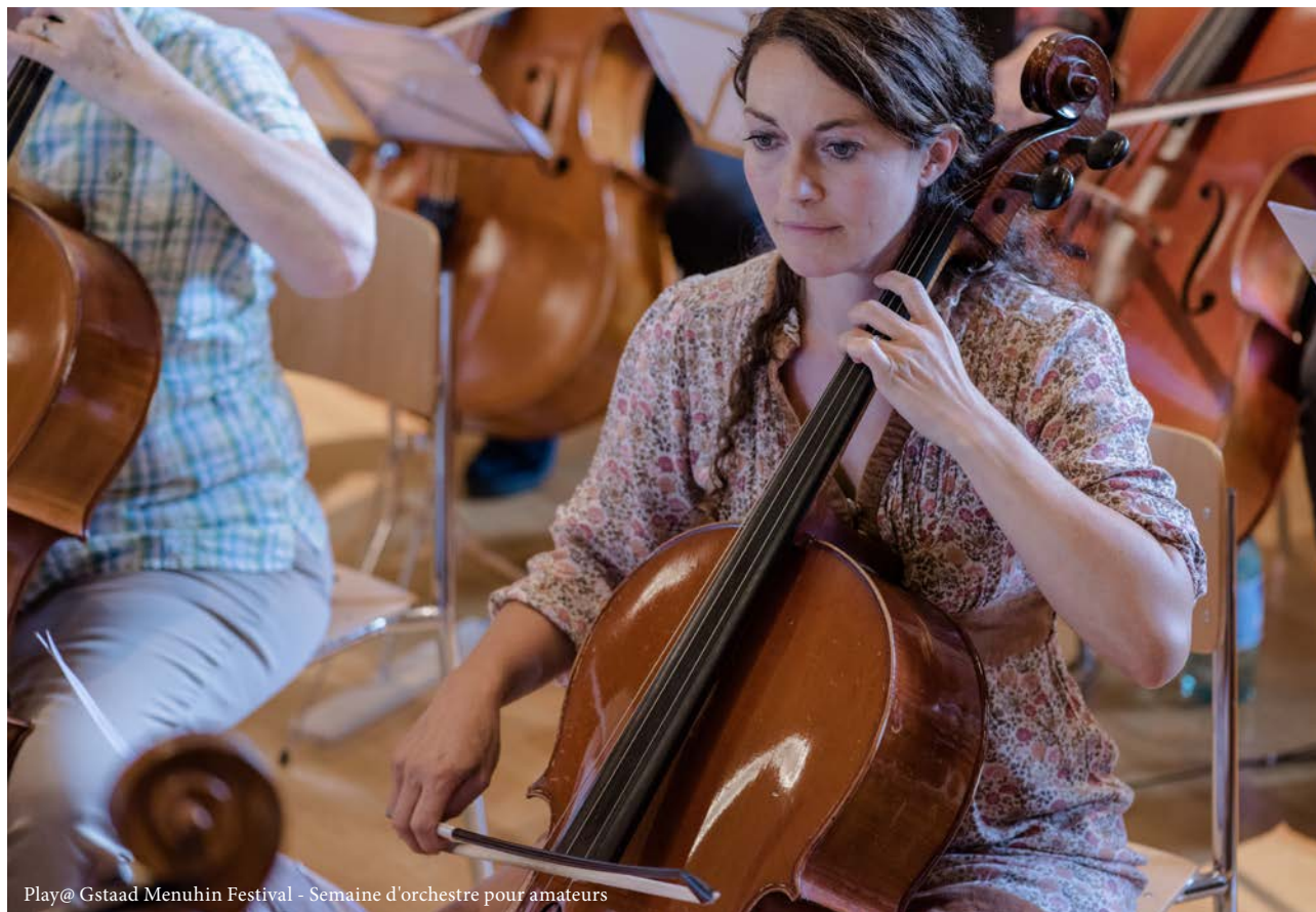
Play@ Gstaad Menuhin Festival - Semaine d'orchestre pour amateurs

4 août 2019, 11h30 Tente du Festival, Gstaad