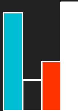
Hoogtes en laagtes van het bijbels zieleleven

Toen het lam het derde zegel verbrak, hoorde ik het derde dier roepen: 'Kom!' Ik zag een zwart paard verschijnen, en hij die erop zat hield een weegschaal in de hand.