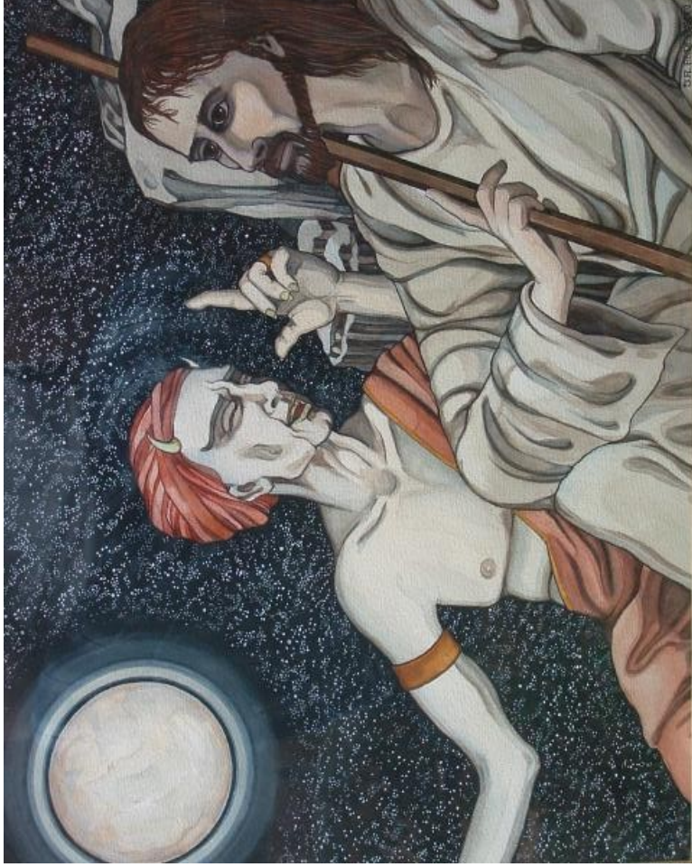
The Temptation of Christ (James Anderson, 2009, © James Anderson)