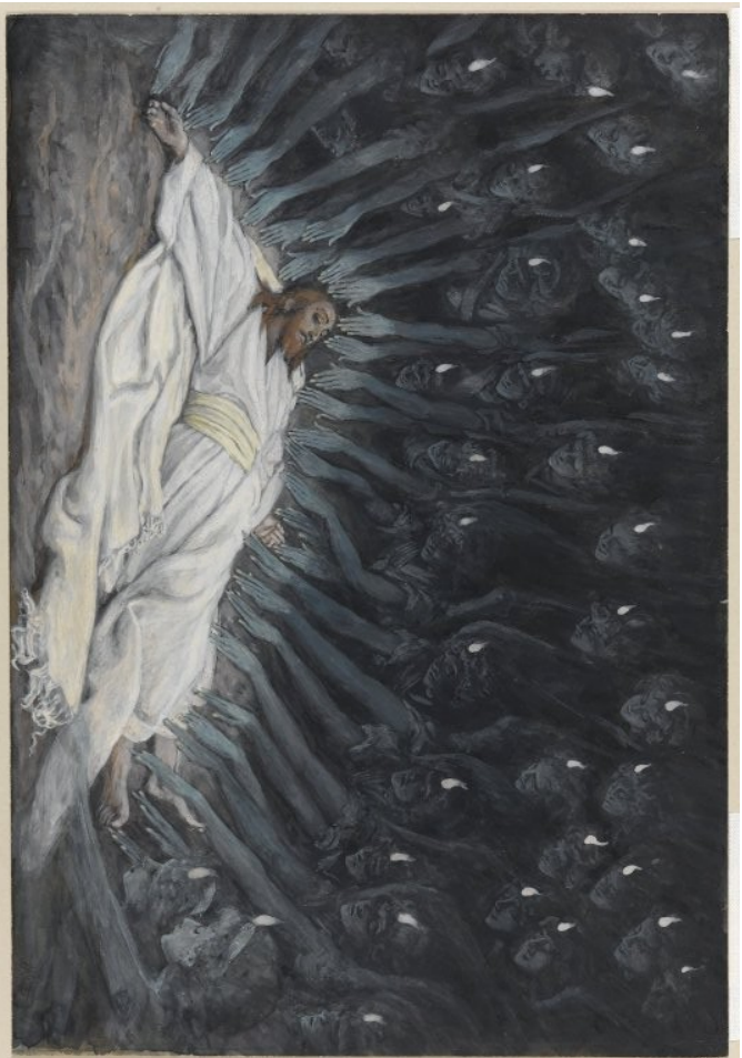
Jésus assisté par les anges (James Tissot, 1886, Brooklyn Museum)

Verteller Nadat de duivel al zijn bekoringen had uitgeput, verliet hij Hem voor een tijd. Hij vertoefde onder de wilde dieren, en zie, de engelen naderden, en dienden hem.