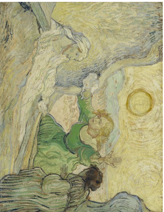
The raising of Lazarus (after Rembrandt) (Vincent van Gogh, 1890, Van Gogh Museum)

Verteller En de dode kwam naar buiten, zijn voeten en handen gebonden met zwaartels en zijn gezicht in een doek gewikkeld.