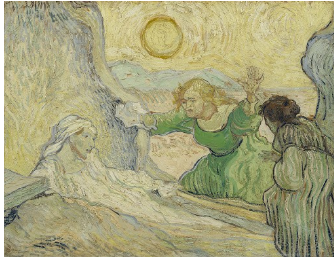
The raising of Lazarus (after Rembrandt) (Vincent van Gogh, 1890, Van Gogh Museum)

Verteller En de dode kwam naar buiten, zijn voeten en handen gebonden met zwachtels en zijn gezicht in een doek gewikkeld.