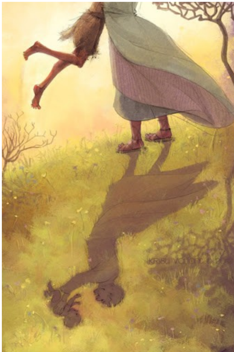
Prodigal Son by Kristi Valiant (Kristi Valiant)

Verteller Nog is hij ver weg, wanneer zijn vader hem ziet, en ten diepste ontroerd wordt; hij vliegt naar hem toe, valt om zijn hals, en overlaadt hem met kussen.