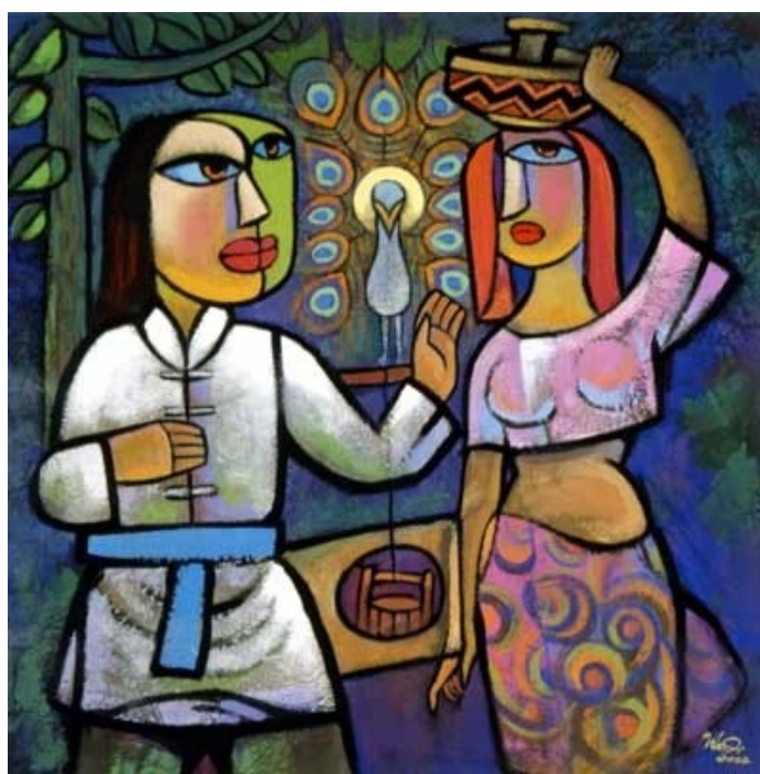
Jesus & The Samaritan Woman (He Qi, 2001, © He Qi)

📍 Bij de waterput, Jezus en Samaritaanse vrouw