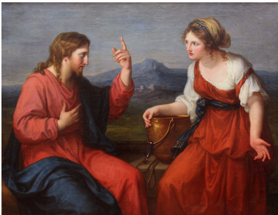
Christus und die Samariterin am Brunnen (Christ and the Samaritan woman at the well), Angelica Kauffman, 1796, Neue Pinakothek, Muenchen