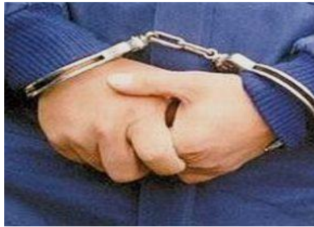
Resim 2.18: Olumsuz koşullar ve kişilik bozukluğunun sonucu “suç”

Aslında suçlu çocuk yoktur, suça itilmiş çocuk vardır. Şiddet davranışlarını tek bir nedene bağlamak doğru değildir. Bu davranışların oluşumunda çevrenin, toplumun, ailenin, çocuğun kişilik özelliklerinin payları vardır. Çevre şiddet davranışlarının oluşumunda önemli bir paya sahiptir. Televizyon, çocuklarda şiddetin yaygınlaşmasında şiddet içerikli dizi, program ve yayınlarla etkili olmaktadır. Sosyo ekonomik durum, ebeveynlerin işsizlik gibi olumsuzlukları hırsızlık, gasp ve madde kullanımını arttırmaktadır.