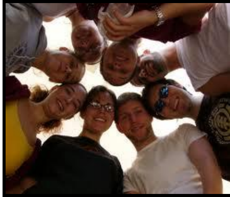
Resim 2.17: Doyum sağlama, bilgi ve deneyim kazanma kaynağı “arkadaşlık”

Öğretmenin gözlemleri ve sosyometri tekniği ile öğrenci ilişkilerini kontrol edip değerlendirerek sınıfın popüler ve sevilmeyen öğrencilerine yardımcı olması gerekir. Anti sosyal çocuğa kızmak onu cezalandırmak durumu daha da zorlaştırır. Nedeni bulup ortadan kaldırmak gerekir. Bunun için aile ile iş birliği şarttır. Öğretmen aileyi tanımalı, onlara rehberlik ederek çocuğun problemini ortadan kaldırmalıdır. Böylece çocuğu üzen onun olumsuz davranışlarına neden olan durumu aile ile birlikte bulup ortaya çıkarma ve onu ortadan kaldırma, çocuğun davranışlarının düzelmesini sağlayacaktır. Bazı çocuklar çok kavgacı olduğu gibi, bazı çocuklar da çok sessiz, çok tavizkar olurlar. Herkesin her istediğini kabul ederler. Her ikisi de düzeltilmesi gereken durumdur. Her şeye evet demek de düzeltilmesi gereken bir durumdur. Önemli olan çocuğun kısa zamanda uzlaşma yolunu bulmasıdır. Kavgacı çocuk için de gerekli önlem alınmalıdır. Zaman zaman yıkıcı olmayan uyarılarda bulunulmalı, olumlu görülen davranışlar ödüllendirilmelidir.