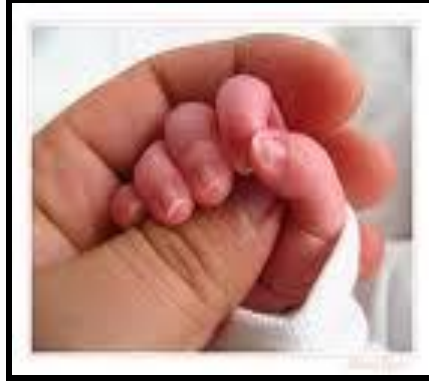
Resim 1.2: Çocukların olağan sorunlarının desteklenmediği dönemlerde büyümesi ve derinleşmesi

Çocukların gelişim dönemlerinde karşılaştıkları güçlükler çoğu zaman probleme dönüşmeden, kâbuslar görme, iştahsızlık, öfke vb. şekillerde de kendini göstermekte ve geçici olabilmektedir.