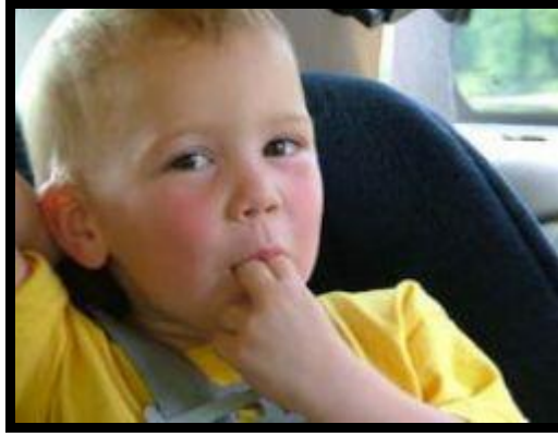
Resim 2.12: Parmak emme sorunu olan bir çocuk

yaratan durumu araştırıp ortadan kaldırmak gerekir. Dikkatini başka yöne kaydırmak daha etkili bir yöntemdir. Bunun için çocuğa sakız ya da kuruyemiş gibi yiyecekler verilebilir. Ayrıca gelişim çağına göre çocuğa parmak emmenin zararlı etkileri anlatılmalı ve çözüm sürecine çocuğun da katılımı sağlanmalıdır. Bazı çocuklar ise yeterince sevgi ve ilgi görmedikleri için parmaklarını emerek dikkat çekmek isterler. Böyle durumlarda çocuk ile yeterince ilgilenilerek onun bu ihtiyacı giderilmelidir. Çocuklardan kapasitelerinin üzerinde beklentilere giren öğretmen ve aileler çocukta gerginlik yaratmış olabilirler. Bu tip beklentilerden vazgeçerek çocuğu tanımaya yönelmeli ve daha gerçekçi hedefler belirlenmelidir. Özellikle aileye yeni bir kardeş katılmış ise büyük çocuğun kaybettiği ilgiyi kazanmak için kardeşi taklit ederek parmağını emdiği sık görülen sebeplerdendir.