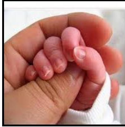
Resim 2.6: Çocukların olağan sorunların desteklenmediği dönemlerde büyüyüp derinleşeceği Alışkanlık ve eğitim problemleri kendi içinde de şu şekilde sınıflandırılmaktadır: