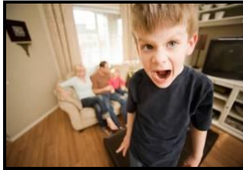
Resim 2.1: Çevresi ve bireyin mutluluğunda uyumun doğru orantısı

Bazı çocuklar, elinde olmayan sebeplerle başkalarıyla anlaşmakta zorlanır, uyuşmazlığa düşer, onlardan farklı davranır, problem çıkarır ve mutsuz olur. Çocuğun bu davranışları çevreyi de olumlu veya olumsuz etkiler. Toplumun ve bireyin mutluluğu uyum ile doğru orantılıdır. Bu nedenle uyumsuzluk, toplum için de birey için de mutsuzluğa yol açar. Problemlili davranış ilerlemeden evvel alınacak tedbirlerle uyumsuzluk önlenabilir.