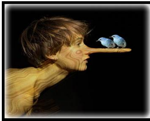
Resim 2.13: Zamanla yalanın alışkanlığa dönüşmesi

Çocuk 7 yaş öncesinde yalan söylemez. Hayal gücü zengin olan çocuklar kendi gerçeğini yalanlarla ifade eder. Duygu ve özlem dünyasını yalanlarla yansıtır. Çocuğun düşle gerçeği karıştırdığı yaşlarda, gerçek olmayan olayları gerçekmiş gibi anlatmasını, içinde bulunduğu yaşın gelişim özelliği olarak nitelendirmek gerekir. Özellikle 5-6 yaşına kadar yalan söylemenin pek önemi yoktur. Hatta bu durumun ortadan kalkması için okul dönemine kadar beklemek gerekebilir. Okul yaşına kadar çocuklar kasıtlı yalan söylemezler ama olayları abartılı bir şekilde anlatırlar. Bazen öyle hayaller kurarlar ki buna kendileri de inanırlar. Çünkü bu dönemlerde çocuklarda belleğin kontrolü henüz gelişmemiştir. Yalan söyleme çocukta bir tür hayal oyunudur. Kısaca diyebiliriz ki çocukların 7 yaş öncesi söyledikleri ve anlattıkları kandırma ve yanıltma amacı taşımaz.