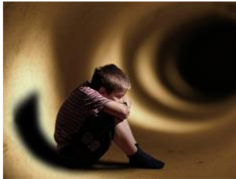
Resim 2.4: Gereğinden fazla korkunun var olduğu tehlikeli durumlar

Ayrıca hangi yaşta olursa olsun ebeveynlerin çok korkulu, endişeli ruh halinde olması çocuğu tedirgin edip kendini güvende hissetme duygusunu yok eder. Çocuk gerek