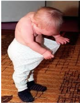
Resim 2. 19: Cinsel gelişimini merak eden bir çocuk

Mastürbasyon, çok erken yaşlarda bile görülebilecek bir gelişim aşamasıdır. Cinsel açıdan reaksiyon verme kapasitesi çok erken başlar ve bebekliđin ilk aylarında dahi basit haz alma davranışları dikkatli yetişkinler tarafından fark edilir. Mastürbasyon, cinsel bölgeyi elle veya bir nesneyle uyarma, oyuncaklara veya yüzükoyun yere uzanıp sürtünme gibi pek çok şekilde görülür. Çocuk banyo ve tuvaletten sonra temizlenme sırasında cinsel organına olan temastan da haz duyar ve bu hazzı yeniden yaşamak için mastürbasyona başvurur. Yalnız kaldıđı anlarda çocuğun daha çabuk aklına gelir, uykuda tekrarlar. Bazen başkalarının varlıđında dahi engellenemez duruma gelir. Belli bir zaman sınırı olmamakla birlikte yoğunluđu ilkokul dönemine dođru azalır, altı yaşından sonra kaybolur veya seyrekleşir. Daha büyük yaşlar için anlaşılır olan bu durumun bu kadar erken yaşta ve yoğun olarak ortaya çıkması pek çok ebeveyn için bazen endişe vericidir. Mastürbasyonun arada bir görülmesi, bir problem deđildir. Aşırı olması ve süreklilik kazanması çocuğun önemli ruhsal gerilimlerinin veya doyum ihtiyacının belirtisi kabul edilir.