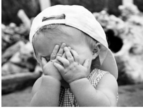
Resim 2.14: 0-2 yaşlarında görülen normal karşılanan utangaçlık

Utangaçlığı problem olarak algıladığımızda; bu çocuklar kendine güveni az, çekingen, içe dönük çocuklardır. Başkalarının bulunduğu olaylardan çekinmeyi tercih ederler. Başkaları için tehlike oluşturmazlar; ama, kendileri için birçok ruhsal duygusal problem yaratırlar. Kendi hallerinde olurlar, yetişkinler için çatışma yaratan çocuk değildirler. Hatta yetişkinlerin gözünde uyumlu ve sevimlidirler; ama, kendi benlikleri çatışma içindedirler.