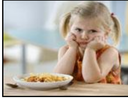
Resim 2.5: İnat eden bir çocuk

Çocukları inattan korumanın çeşitli yolları vardır. Çünkü inat kişilik özelliğinden çok çevre etkisi ile oluşan bir durumdur. Bu durumu düzeltmek ve kişide belirgin hale getirmemek için şu tedbirler alınmalıdır: