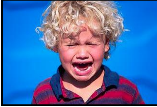
Resim 2.2: Çocuğun hareketlerinin yerli yersiz engellenmesinden doğan sonuç; öfke

Çocuğun öfke sonucunda kazançlı çıkacağı inancı bunu alışkanlık haline getirir. Nedenler incelendiğinde öfkenin uygun bir eğitimle düzeltilebileceği anlaşılmaktadır. Öfkenin düzeltilebilmesi için alınacak önlemler şunlardır: