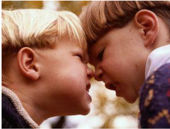
Resim 2.3: Saldırgan çocukların gergin ve sürtüşmeli ilişkileri

Çocuklarda 1-3 yaşları arasında doğal saldırgan bir dönem vardır. Çocuk büyüyüp istekleri arttıkça her zaman istediği her şeye sahip olamayacağını anlar. Bu engellemelere