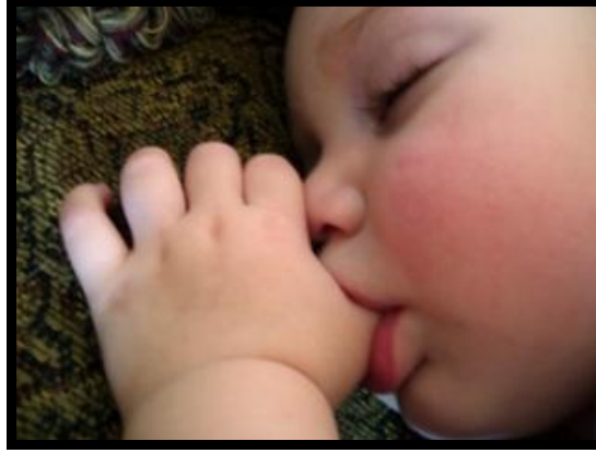
Resim 2.11: Bebeklerin sahip olduğu en güçlü reflekslerden emme refleksi

Parmak emme davranışı kronikleşmedikçe ve diğer problem davranışlarla birlikte ortaya çıkmadıkça bir bozukluk olarak görülmez; ancak, süregelmesi halinde dişlerde deformasyona neden olabileceği kanıtlanmıştır. Parmak emme davranışının başlangıcı çoğunlukla dokuz ay ve öncesidir. Dokuzuncu aydan itibaren uykusu gelen bebeklerin parmaklarını ağızlarına götürdükleri sıklıkla karşılaşılan bir durumdur. Çocuğu parmak emmeden vazgeçirmek üzere yapılan çabalar, 3- 4 yaşına kadar çocuk tarafından dirençle karşılanır. Bazı bebekler yeni dişlerinin çıkması, bazıları da zorlukla karşılaştıklarında utanma ve sıkılma belirtisi olarak parmaklarını emerler. 3-4 yaşlarına kadar normal görülmesi gereken bir olgudur.