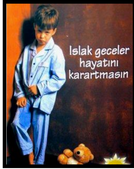
Resim 2.10: Alt ıslatma problemi ve çocuğun kişilik gelişimi ilişkisi

Alt ıslatmanın nedenlerini aşağıda belirtildiği şekilde gruplayabiliriz: