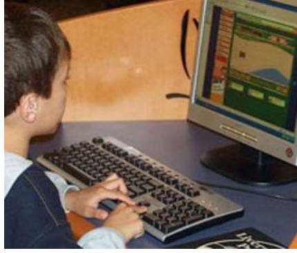
Resim 2.20: İnternetteki bir takım sitelerin bilgi kirliliğinin çocuklara verdiği zararlar

Homoseksüellerle toplumun değer yargıları arasında oluşan çatışmalar sonrasında ortaya çıkan sorunlar çoğunlukla bozukluk olarak gözlemlenir. Bununla birlikte, gördükleri ayrımcılık, baskı ve saldırganlık nedeniyle homoseksüellerin psikolojik ve duygusal zorlanmalar karşısında depresyona ve uyum bozukluğu olarak değerlendirilebilecek durumlara yatkınlıklarının arttığı, bunun sonucunda özellikle intihara eğilimde önemli artışların olduğu görülür.