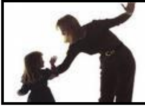
Resim 1.3: Uyumsuzluk nedenlerinden ana-babanın yanlış tutumları

Eğitim insanlarda doğru, olumlu ve uyumlu davranışın gelişmesini amaçlar. Planlı, programlı ve titizlikle verilmeyen eğitim tam tersi sonuçlar doğurabilir. Yanlış eğitim çocuklarda uyumsuz davranışların gelişmesinde önemli bir etmendir. Çocuklara uygun eğitim olanakları sunulurken önce kendisi, sonra çevresi tanıtılmalıdır. Böylece çocuğun kendi yetenek ve imkânlarını bilmesi, çevresini ve toplumu tanıması ve dengeyi kurması sağlanmış olur. Kararlı, düzenli, doğru ve istikrarlı bir eğitim uyumsuzluklara neden olamayacağı gibi mevcut uyumsuzlukları da sona erdirir.