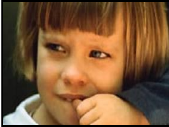
Resim 2.8: Psikolojik kökenli bir alışkanlık “tırnak yeme”

Çocuklara tırnak yemenin sakıncaları, bunun çok önemli olmasa da psikolojik bir rahatsızlık olduğunun açık ve net bir dille anlatılması da etkili bir yöntemdir. Çocuğun kendi tırnak bakımıyla uğraşması da alışkanlığın giderilmesinde yararlı bir yöntemdir. Bu konuda kız çocuklar tırnak bakımı için gerekli malzemeler alınarak da özendirilebilir. Ayrıca tırnaklar uzatılmadan kesilmeli böylece tırnak yeme zorlaştırılmalıdır.