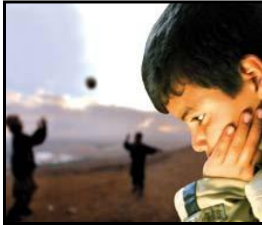
Resim 1.1: Çocukların gelişim dönemlerinde karşılaşması muhtemel olaylar

Çocuklar gelişim dönemleri sürecinde yeni yetenekler ve beceriler kazanma çabası ile birlikte topluma uyum sağlamaya çalışırlar. Gelişim dönemlerinde çocukların birçok sorun ile karşılaşması doğaldır. Kişilik; bu sorunların uygun çözümler geliştirilerek aşılması ve uyum çabaları sonucu şekillenmektedir.