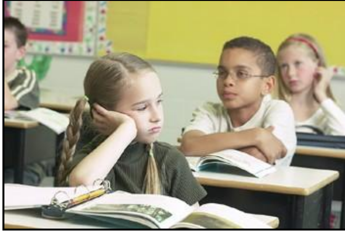
Resim 2.15: Dikkat dağınıklığının okul başarısı ve sosyal ilişkilere olumsuz etkileri

Çocukların okulda, arkadaş ortamlarında dikkat sorunu yaşamaları, hem ders başarısını hem sosyal ilişkilerini olumsuz etkiler. Başarısızlıkları düşük benlik algısı geliştirmelerine neden olur. Her zaman başarısız olacakları, beceremeyecekleri inancıyla işe başlayan çocuklarda bu düşünce kısır döngü olarak onları başarısızlığa sevk eder. Yetersizlik duyguları, ilişkilerindeki bozukluk içlerinde büyük üzüntüye sebep olur ve öfke duygularını uyandırır. Bu öfkelerini ya içlerine atarak kendilerine zarar verme yolunu seçerler ya da herkesi rahatsız edecek biçimde, saldırganlıkla çevreye yöneltilir.