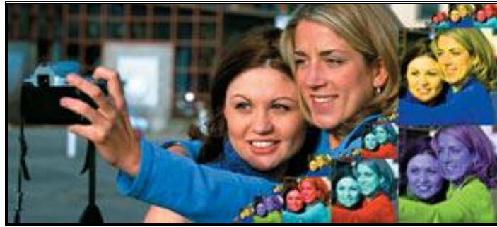
Resim: 1. 7: Fotoğrafta ışığın etkisi

Fotoğrafta kullanılan ışığı, sıcak ve soğuk renkler olarak gruplandırabiliriz. Sıcak renkler, makyajda tercih edilen sarımsı tonları içerir. Doğal cilt tonları ve altın gölgelerle yüz hatlarının keskin hatlardan uzaklaştırarak yumuşak hatlar oluşturmaya yardımcı olur. Fotoğraf sanatçısı sıcak renkleri tercih ettiğinde makyaj için de sıcak tonlar tercih edilmelidir. Porselen pembesi tonlarından kaçınılmalıdır. Aynı şekilde mum ışığı ile aydınlatılmış bir ortamda bulunulacaksa pembe, mor renklerden ve çok açık makyaj tonlarından kaçınılmalıdır.