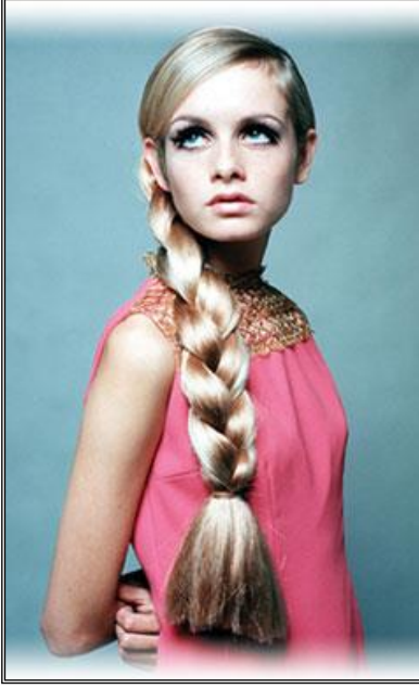
Resim 3. 4: Fotoğrafta başın duruşu