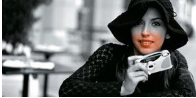
Resim 1. 1: Fotomodel poz veren kişi

Fotomodel; fotoğraf sanatçısının verdiği talimatlar doğrultusunda, kendisine verilen görev gereği; fotoğrafı çekilecek giysi veya aksesuarları konseptte uygun bir şekilde taşıma, uygun, bakış, ifade şekilleri ve duruş şekilleri ile poz verme işini yapan kişidir.