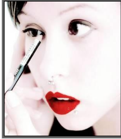
Resim 1. 6: Cilt ürünleri tanıtımı