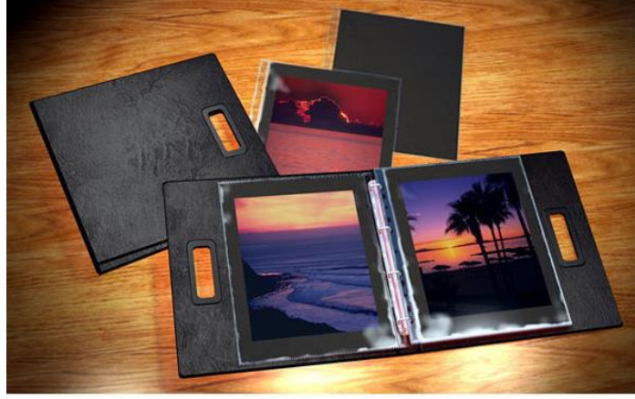
Resim 2.10:Fotoğraf arşivlemek

Hangi portfolyo türü tercih edilirse edilsin portfolyoya isim, e-mail adresi, telefon, adres, unvan vb. gibi kimlik bilgilerinin yer aldığı bir sayfayla başlanmalı, içerik ve görünüm konusunda seçici olunmalı; yarım kalmış, sahibini anlatmayan çalışmalara yer verilmemeli, en güçlü ve en güvenilen çalışmalarla dosya hazırlanmalıdır.