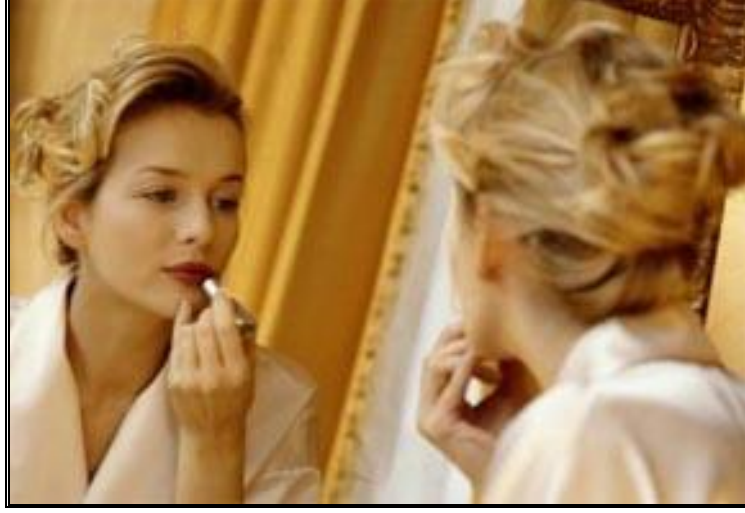
Resim: 2. 4: Gündüz makyajı yapmak

Sektör açısından makyajın bizi ilgilendiren yanı profesyonel makyaj eğitimidir. Bu eğitimin kapsamı; anatomi ve mimik makyajı, plastik makyaj, gece- gündüz makyajı, gelin makyajı, manken-fotomodel makyajı tekniklerinden oluşmaktadır.