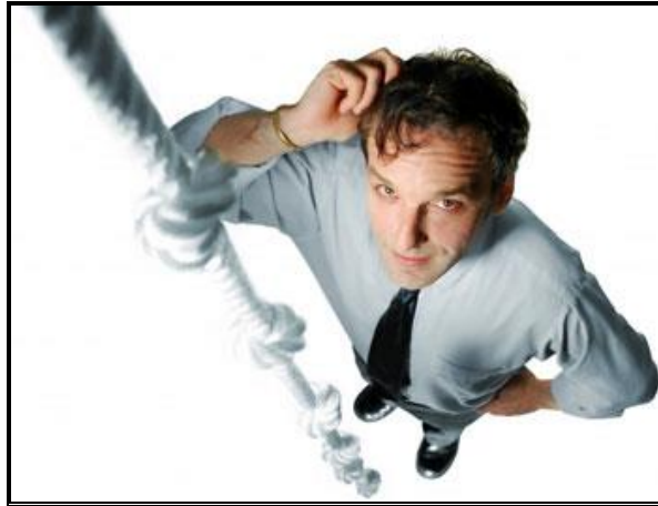
Resim 3. 3: Fotoğrafta bakış ve duruş

Beden dilimizde jestler ve mimikler; oturuş, duruş gibi çeşitli tavırlarla kendini ortaya koyar. İnsanlar arası iletişimde bireyin durumuna ilişkin değerlendirmelerini taşıyan bu araçlara sözsüz mesajlar denir. Sözsüz mesajlarla yapılan bu anlatım biçimine de sözsüz iletişim denir. Fotoğraf çekimlerinde kullanılan sözsüz iletişim, kişilere mesaj vermeye yöneliktir. Fotoğrafta başarı; istenilen mesajı, bakış, duruş ve ifadelerle verebilmekle mümkündür.