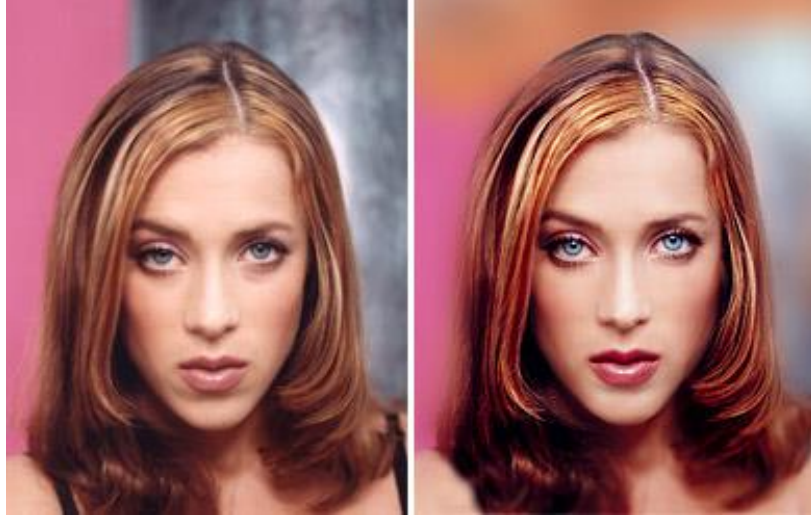
Resim: 1. 6:Fotoğrafta ışığın etkisi

Fotoğraf, "ışıkla boyamak" olarak tanımlanabilir. Buradan yola çıkarak, ışığın fotoğrafı nasıl etkilediğini bilmeden doğru makyaj neticesi almamız mümkün olmamaktadır.