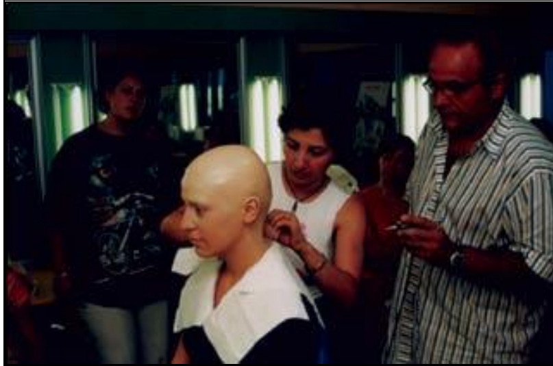
Resim: 1. 5: Plastik makyaj yapmak

Son yıllarda, özellikle televizyonun işlevinin de giderek artmasıyla reklam, şov ve kliplerde profesyonel anlamda makyaja olan ihtiyaç büyümektedir. Makyajı yapılacak kişinin öncelikle yüz anatomisi incelenmektedir. Yüz; alın, burun, çene olarak üç yatay bölüme ayrılır. Bu üç bölümün birbirine oranı göz önüne alınarak kusurlu görülen yerler ve yüksekliklere açık renklerle, belirginleştirilmesi gereken yerlere ise koyu renklerle makyaj yapılır. Bu çalışma ile yüzün üç bölümün birbiriyle uyumu sağlanarak yüzde bir orantı kurulmaktadır. Örneğin; köşeli çene kemikleri açık renk gölgelerle yumuşatılırken gerektiğinde elmacık kemiklerine koyu gölgelerle belirginlik kazandırılır.