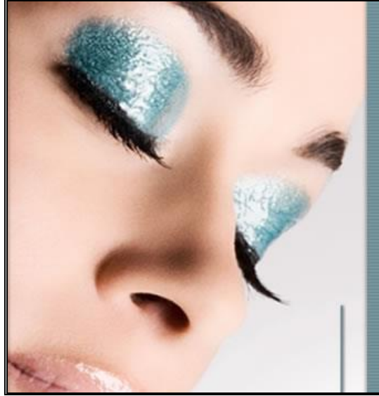
Resim: 2. 8: Fotoğrafta fotomodel ve fotoğrafçının başarısı

Fotoğraf, geleneksel yaratıcılık yollarından (resim ve heykel) farklı olarak, görselliği fotoğrafçının gerçekliğiyle doğrudan karşılaştıran bir misyona sahiptir.