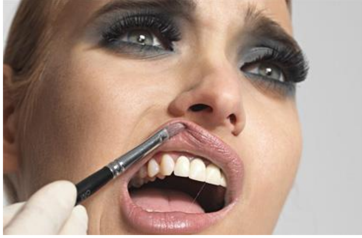
Resim 3. 1: Jest ve mimikler