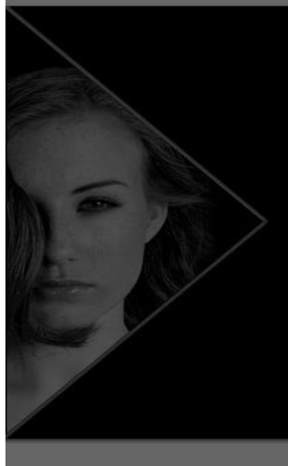
Resim 1.7: Siyah-beyaz konsepti