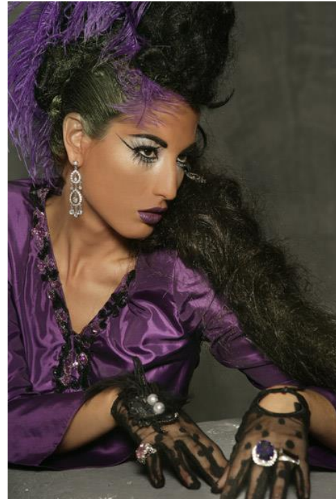
Resim 1.4: Manken fotomodel