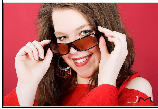
Resim 1. 5: Gözlük reklâmı