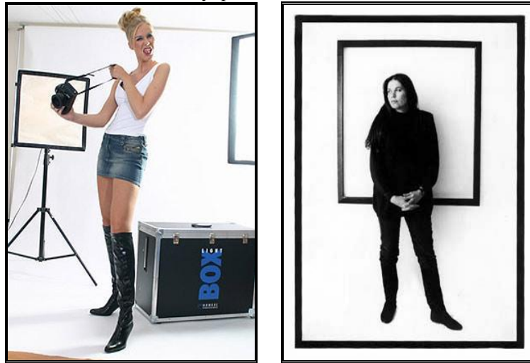
Resim: 2. 1: Çekim için hazırlık yapmak

Ne tür bir çalışma içerisinde olunursa olunsun, iyi bir sonuç alınabilmesi için ön hazırlık aşamasının verimli geçirilmesi gerekir. Farklı ortamlarda çekim yapılırken de konseptin gerektirdiği biçimde kostüm, dekor, ışık, makyaj, vb. ayrıntılar için yapılan ön hazırlıkların yanı sıra, ekibin bir parçası olan fotomodel de ön hazırlıklarını yapmalıdır.