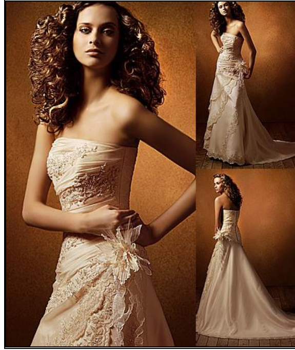
Resim: 2. 9:Fotoğraf çekirmek