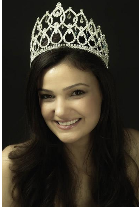
Resim 1.3: Güzellik yarışmaları