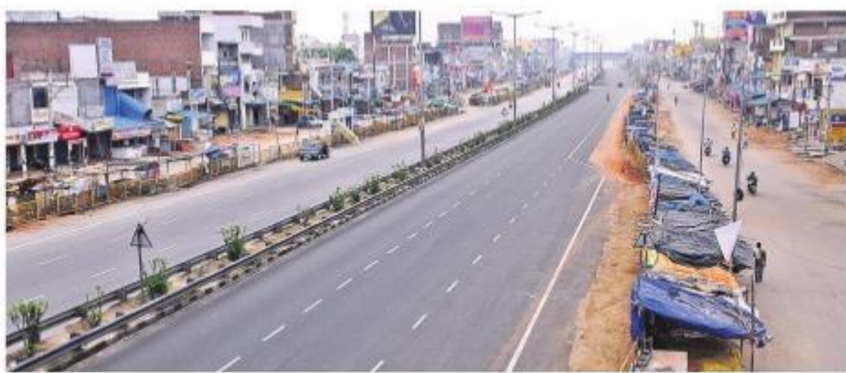
చౌటుప్పల్ లో నిర్మాణమయంగా మారిన హైదరాబాద్ - విజయవాడ హైవే