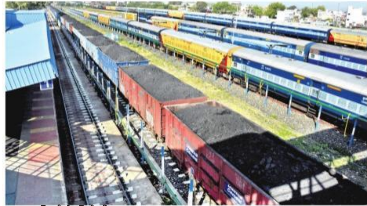
అదిలాబాద్ రైల్వే స్టేషన్లో ఆగి ఉన్న రైళ్లు