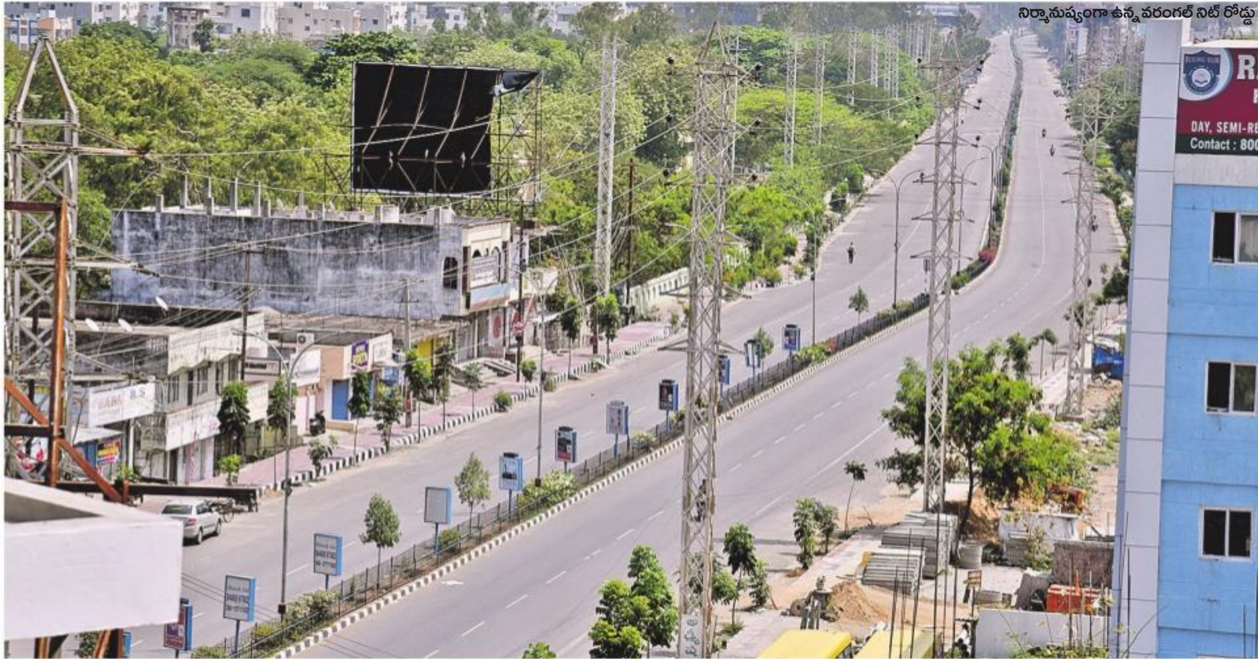
నిర్మాణం ద్వారా ఉన్న వరంగల్ నిట్ రోడ్డు