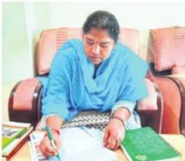
పీహెచ్ డి ప్రవేశంలో ములుగు ఎమ్మెల్యే సీతక్క