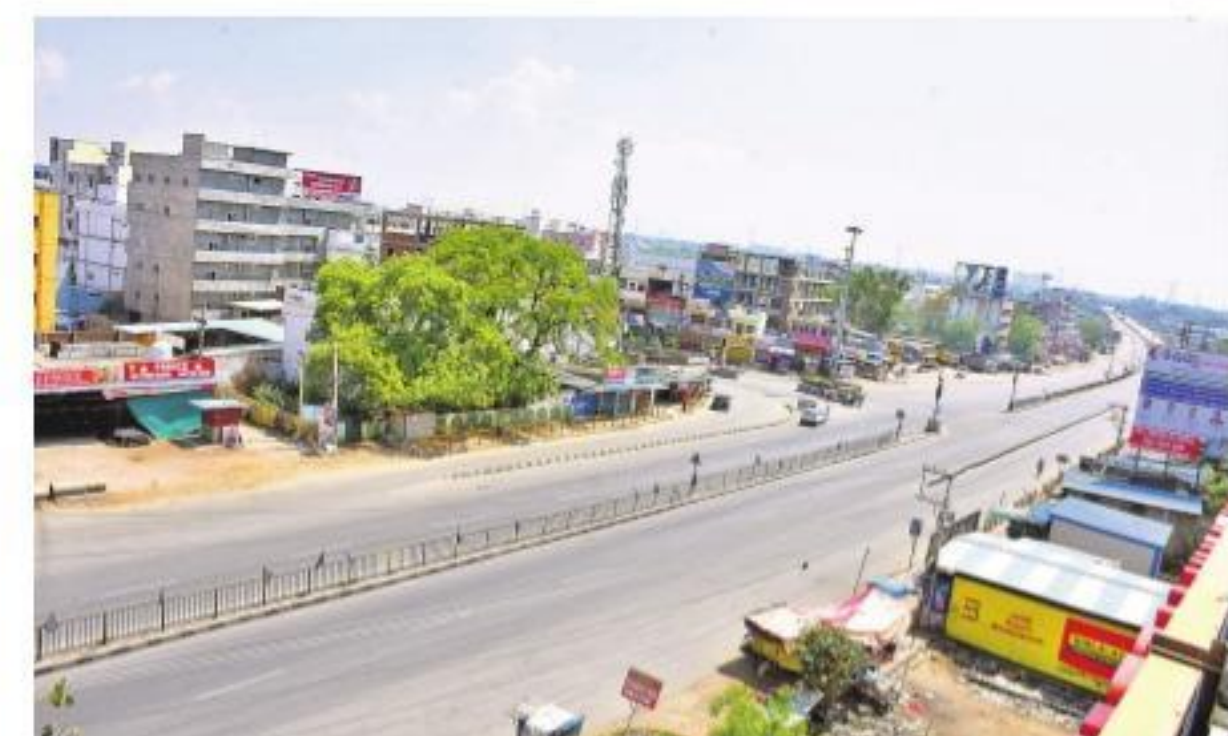
సంగారెడ్డి: నిర్మాణమయంగా మారిన బాంబే హైవే