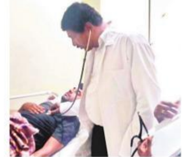
పేషెంట్లను చెకప్ చేస్తున్న స్టేషన్ ఫున్ షూర్ ఎమ్మెల్యే రాజయ్య