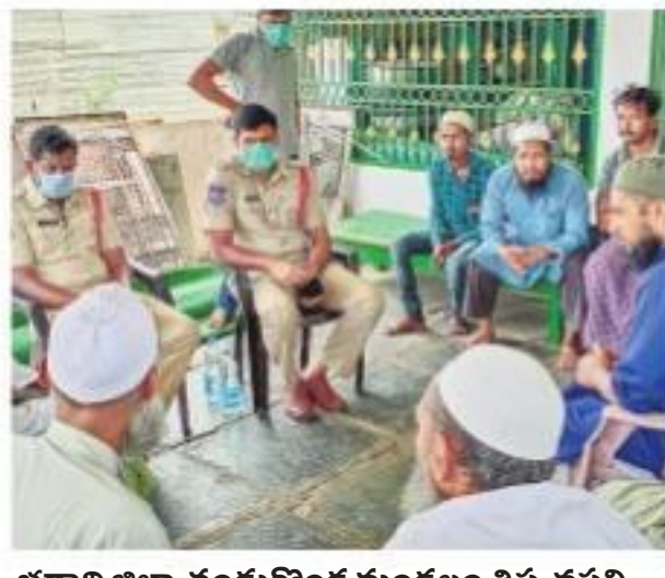
భద్రాద్రి జిల్లా చంద్రగిరి మండలం తిప్పనపల్లి మసీదులో మత పెద్దలతో మాట్లాడుతున్న పోలీసులు