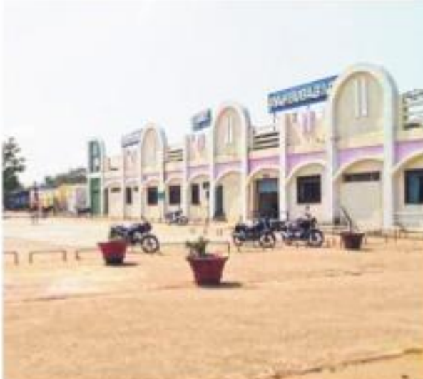
బోసిపోయిన మానుకోటి రైల్వేస్టేషన్