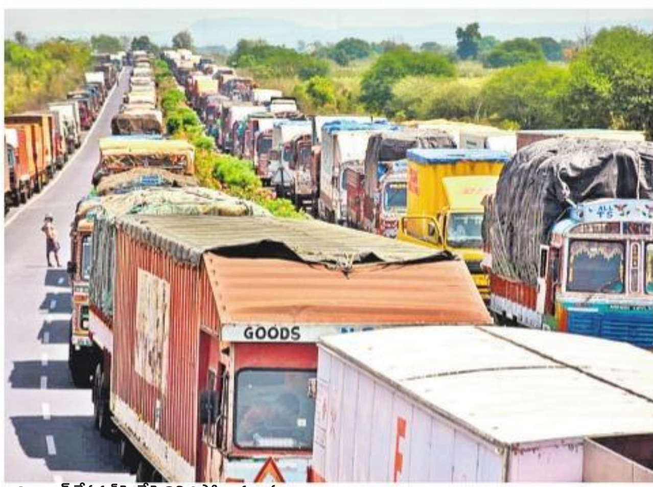
అదిలాబాద్ నగరంలో హైవేపై నిలిచిపోయిన వాహనాలు

ఇళ్లలో కుటుంబసభ్యులతోనే గడిపారు. జగిత్యాల జిల్లాలో దుబాయి నుంచి వచ్చిన ఆరుగురిని సెల్స్ క్వారంటైన్లో గడపాలని సూచించారు. మెట్ పల్లి మండలం జగ్గాసాగర్లో ఓ వ్యక్తి అంత్యక్రియలు వాయిదా వేశారు. ఎల్లారెడ్డిపేట మండలం హరిదాస్ నగర్ గ్రామానికి చెందిన వ్యక్తి హోం క్వారంటైన్ నుంచి బయట తిరగడంతో కేసు నమోదు చేశారు. కరీంనగర్లో ఇండోనేషియా వారితో కలిసి తిరిగిన ఓ వ్యక్తిని శనివారం పట్టుకుని హాస్పిటల్ కు తరలించారు. ఉమ్మడి నిజామాబాద్ జిల్లా పరిధిలోని రోడ్లన్నీ నిర్మాణానికి మారాయి. 650 బస్సులు డిపోలోనే నిలిచిపోయాయి. మహారాష్ట్ర సరిహద్దులోని అంత రాష్ట్ర చెక్ పోస్టులను అధికారులు శనివారం రాత్రి మూసివేశారు. సాలూర చెక్ పోస్టు వద్ద క్వారంటైన్ స్టాంప్ ఉన్న వ్యక్తిని గుర్తించి వెనక్కి పంపించారు. సీపీ కారితేయ, కలెక్టర్లు పరిస్థితిని ఎప్పటికప్పుడు పర్యవేక్షించారు. సాయంత్రం 5 గంటలకు ఆపేసినట్లు ప్రజాప్రతినిధులు, ప్రజలు దాక్కడ సేవలకు సంఘీభావంగా చప్పట్లు కొట్టారు.