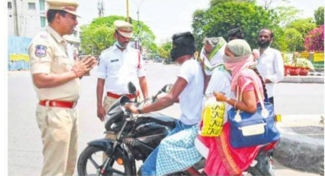
బయటికి రావాద్దని దండం పెడుతున్న పోలీస్