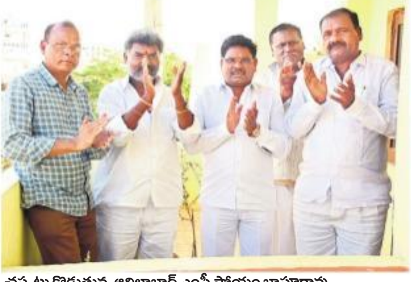
చప్పట్లు కొడుతున్న అదిలాబాద్ ఎంపీ సోయం బాపూరావు