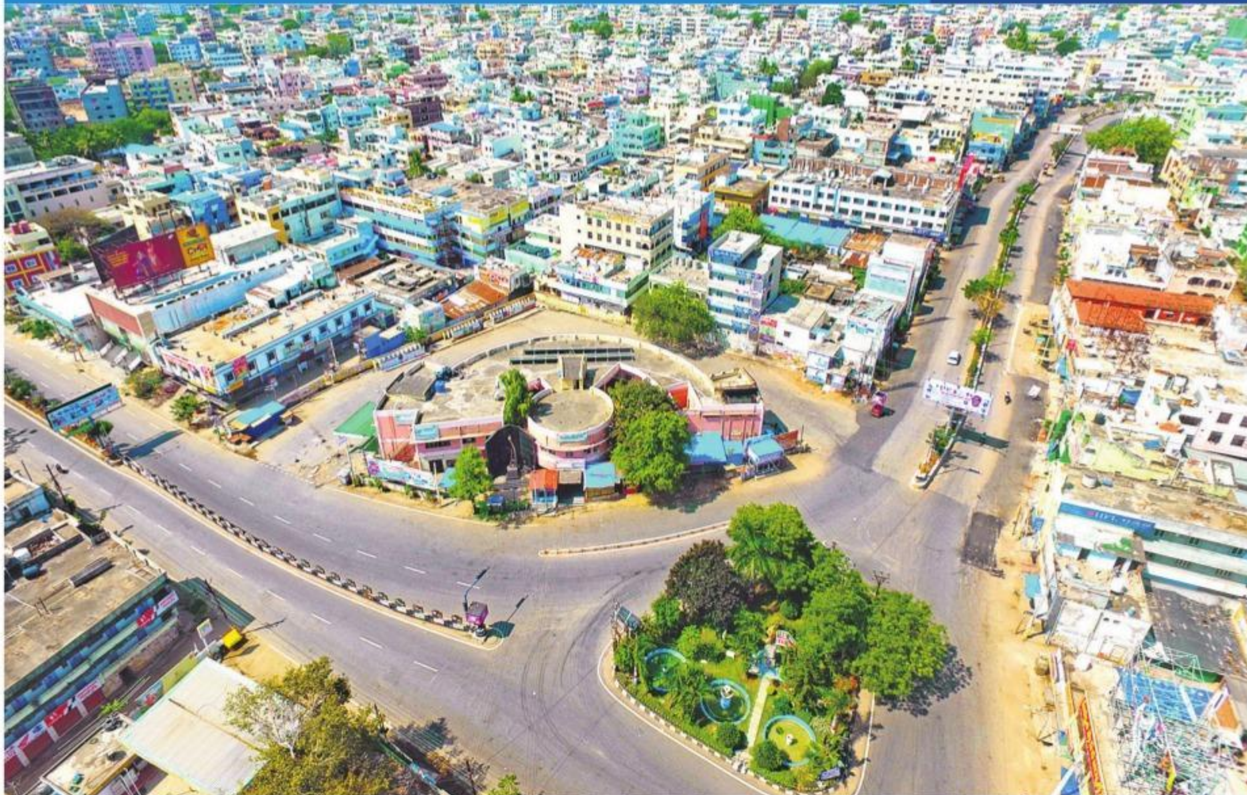
సిద్దిపేటలో నిర్మాణమయంగా ఉన్న రోడ్డు