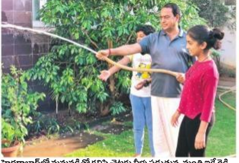
హైదరాబాద్లో మనుషుడితో కలిసి చెట్లకు నీళ్లు పడుతున్న మంత్రి బకే రెడ్డి