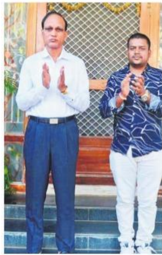
చప్పట్లు కొడుతున్న మెదక్ కలెక్టర్ ధర్మారెడ్డి