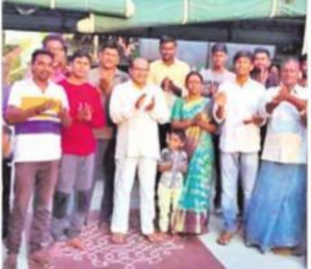
దమ్మవేట మండలం తాటిసుబ్బన్న గూడెంలో చప్పట్లు కొడుతున్న ఎమ్మెల్యే ఫ్యామిలీ