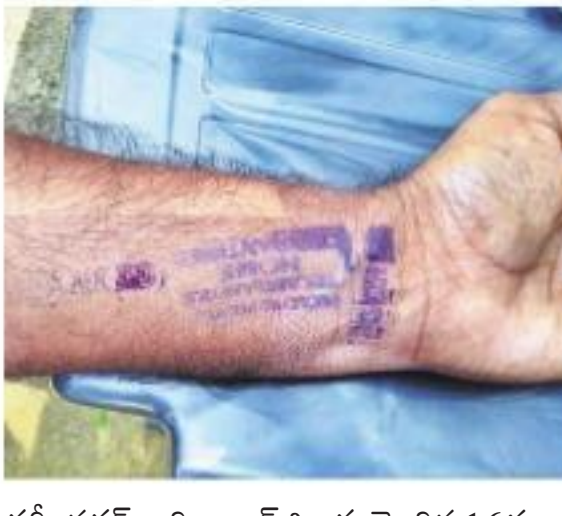
కరీంనగర్, ఆదిలాబాద్ జిల్లాకు చెందిన 16 మందిని తెలంగాణ స రిహద్దున ఉన్న బోర్నిస్ మండలం సాలూర చెక్ పోస్టు వద్ద ఆఫీసర్లు అడ్డుకున్నారు. దీంతో వారు ఆఫీసర్ల కళ్ళు గుట్టి పొల్లలో నడుచుకుంటూ వచ్చి బా ర్టర్ దాటారు. మెట్ పల్లి, మంచిర్యాల, నిర్మల్, బాల్యంద ప్రాంతాలకు చెందిన 16 మంది ఆదివారం ఉదయం 4 గంటలకు ముంబై ఎయిర్ పోర్ట్