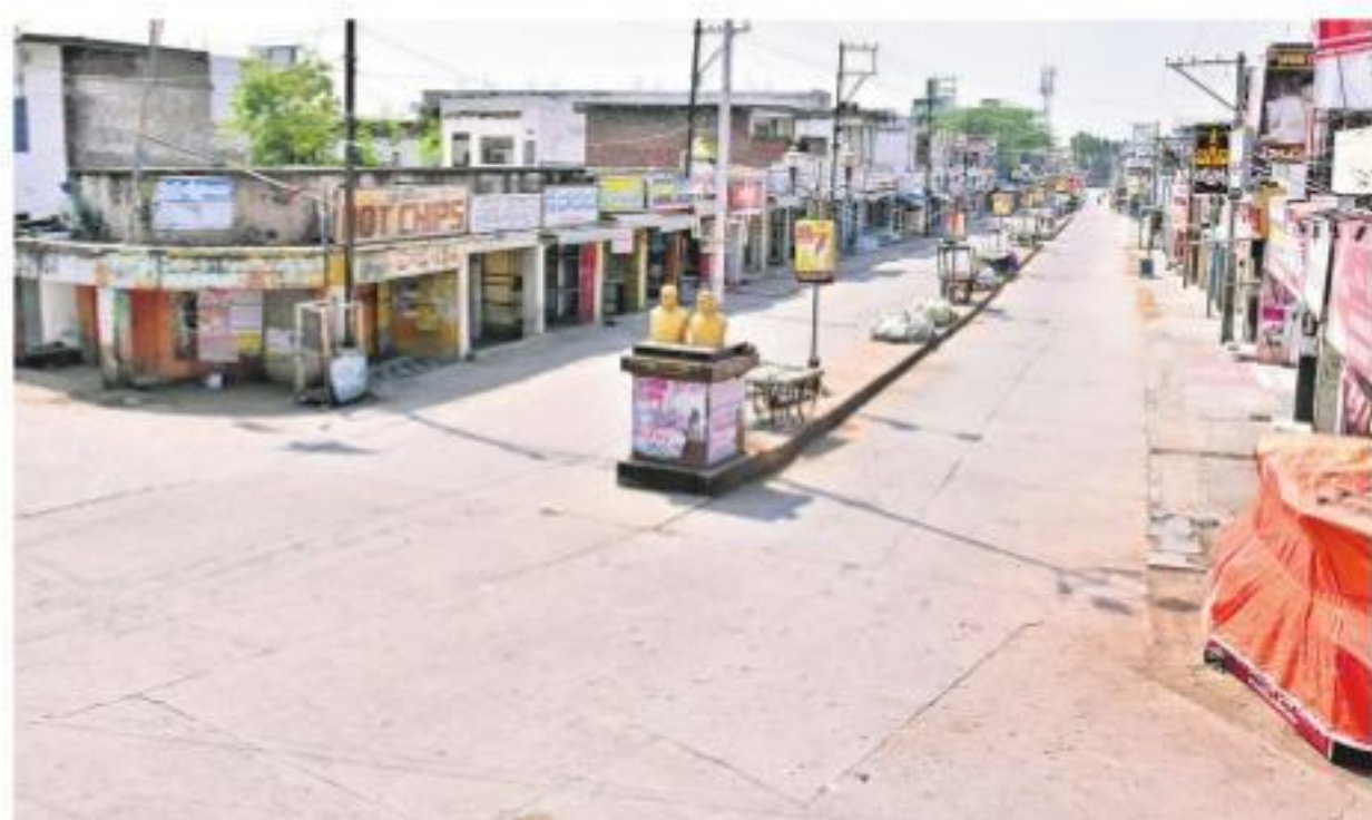
నల్గొండలో ఖాళీగా కనిపిస్తున్న ప్రకాశం బజార్