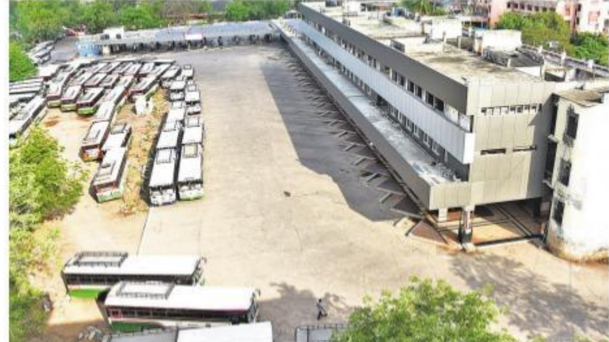
కరీంనగర్ బస్టాండ్లో నిలిచిపోయిన బస్సులు