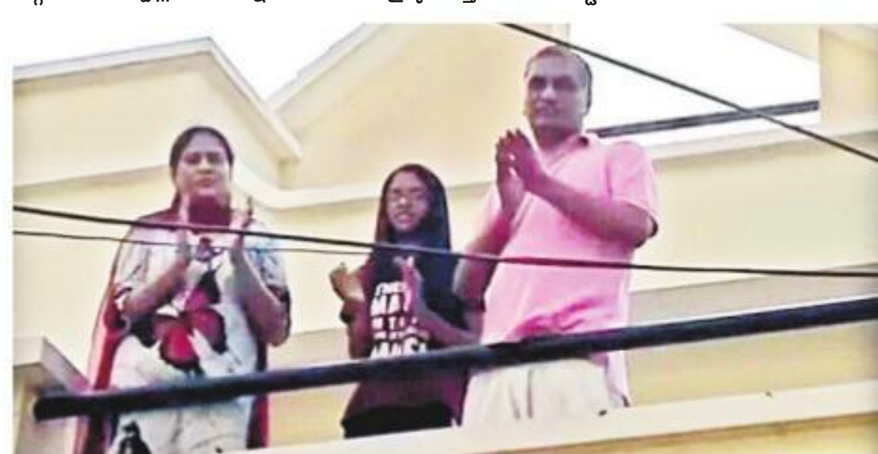
హైదరాబాద్ లో కుటుంబ సంభ్యులతో కలిసి చప్పట్లు కొడుతున్న మంత్రి హరీశ్ రావు