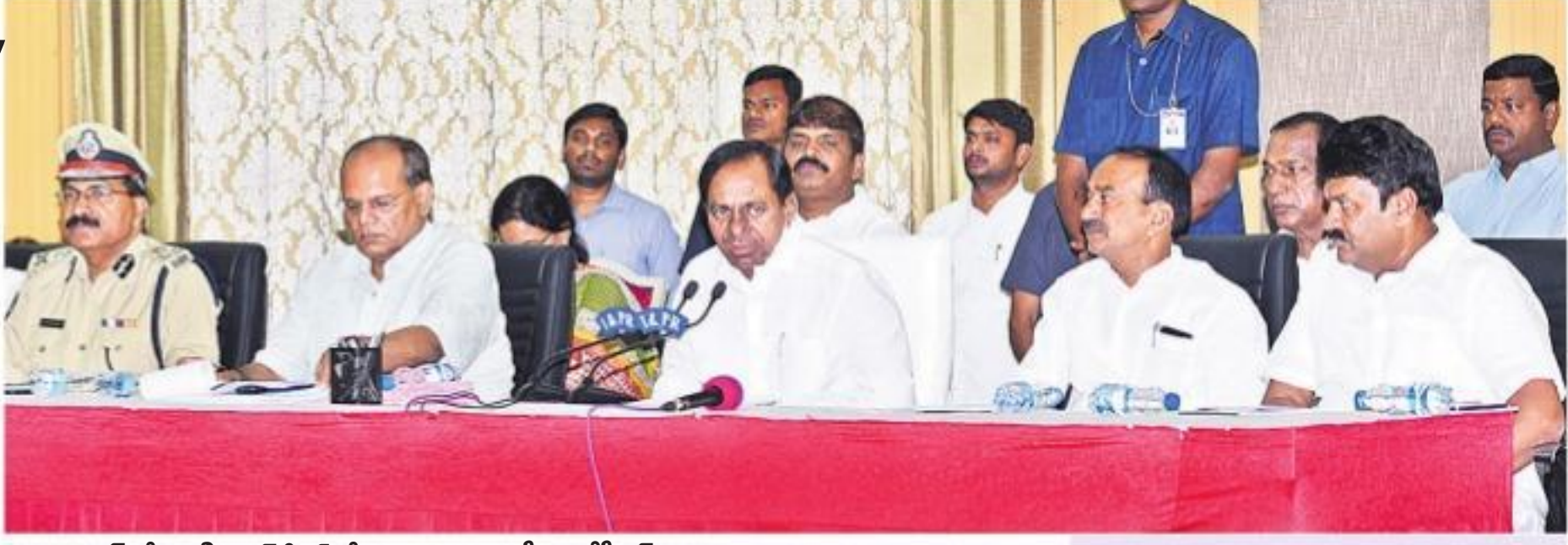
ప్రగతిభవన్లో జరిగిన ప్రెస్ మీట్లో మాట్లాడుతున్న సీఎం కేసీఆర్, పక్కన మంత్రులు ఈటల, తలసాని

హైదరాబాద్, వెలుగు: కరోనా వైరస్ వ్యాప్తిని అడ్డుకునేందుకు ఈ నెల 31 వరకు రాష్ట్రం లాక్డౌన్లో ఉంటుందని సీఎం కేసీఆర్ ప్రకటించారు. అప్పటివరకు ఎవరైనా సర్వీసులు తప్ప అన్నిటిని బంద్ చేస్తున్నామన్నారు.