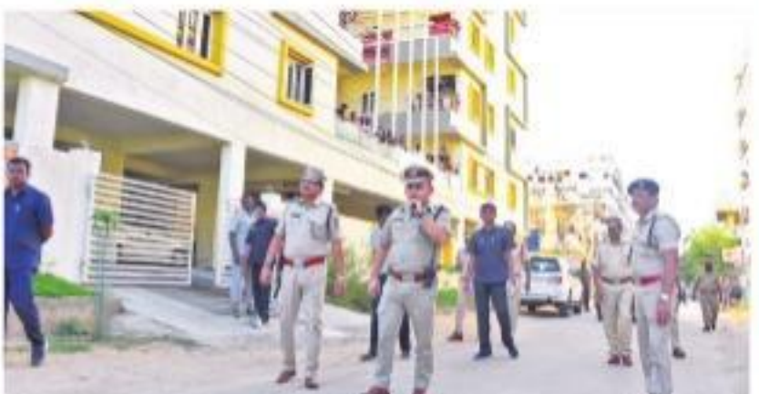
నిజామాబాద్లో పర్యటిస్తున్న పోలీస్ కమిషనర్ ఆర్కలేయ