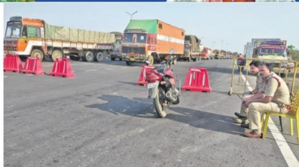
అలంపూర్: బోర్డర్లో వాహనాలను నిలిపిస్తున్న పోలీసులు