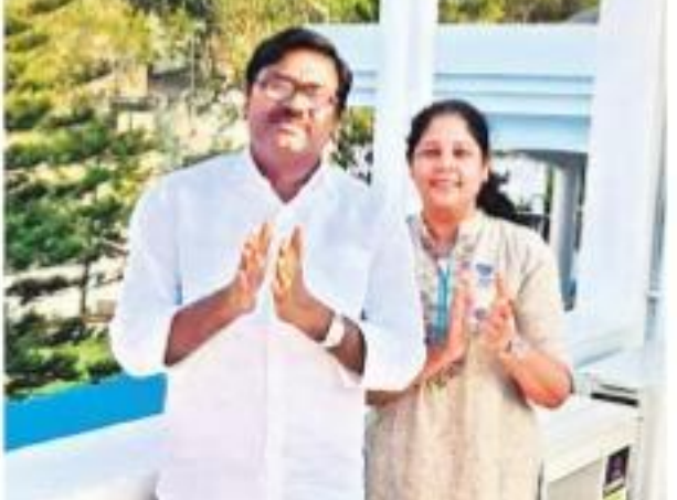
హైదరాబాద్ లో డాక్టర్లకు సంఘీభావంగా చప్పట్లు కొడుతున్న మంత్రి అజయ్ దంపతులు