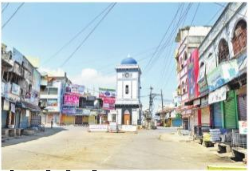
జగిత్యాల క్లాక్ టవర్ సెంటర్..