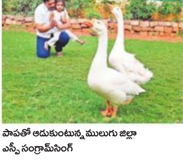
పాపటి ఆడుకుంటున్న ములుగు జిల్లా ఎస్పీ సంగ్రామ్ సింగ్