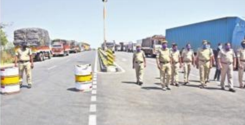
మహారాష్ట్ర సరిహద్దులోని మండగాడ వద్ద వాహనాలు నిలిచిపోయిన ఆఫీసర్లు