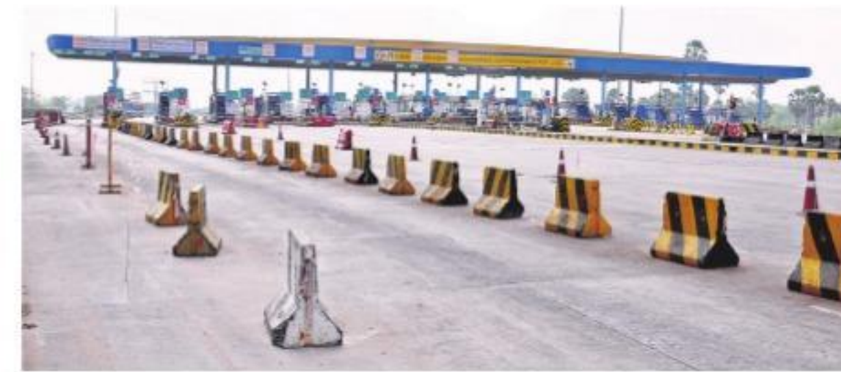
చౌటుప్పల్: ఖాళీగా కనిపిస్తున్న పంతంగి టోల్ ప్లాజా