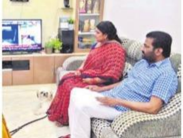
టీవీ చూస్తున్న డిసినీజ్ వైర్లెస్ మార్కెట్