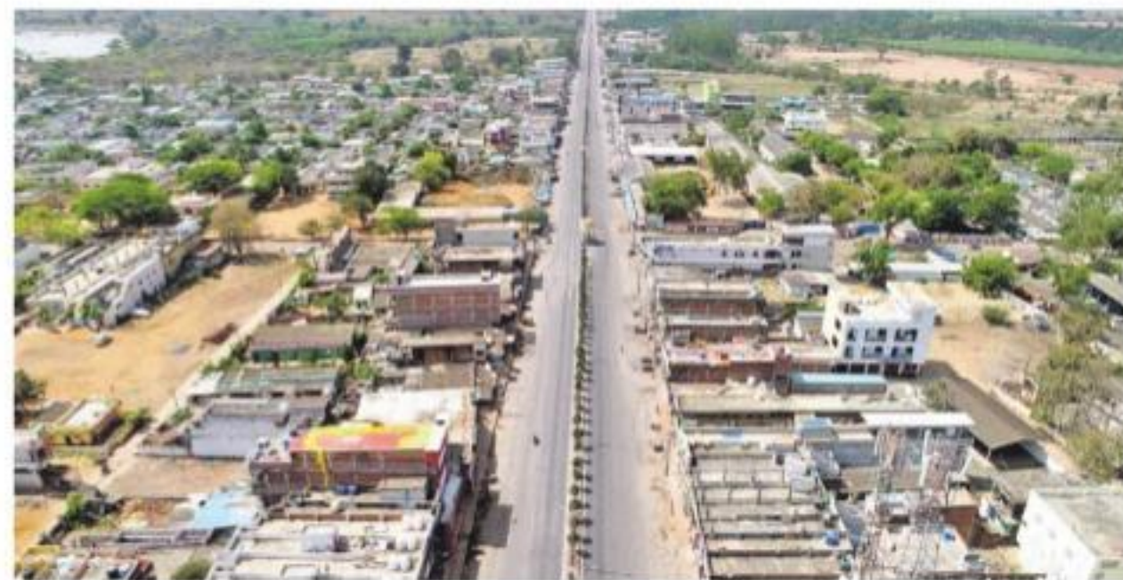
జనతా కర్ష్యాతో నిర్మాణం ద్వారా ఉన్న భూపాలపల్లి పట్టణం

వో భాన్వర్ నూనాక్ వైద్యసౌకర్యంతో వెళ్లి ఆరోగ్య పరీక్షింపి తెలుసుకున్నారు. చంద్రగిరి మండలం తిప్పనపల్లిలోని మసీదుకు ఉత్తర ప్రదేశ్ నుంచి వచ్చిన బందు కుటుంబాల ముస్లిం మత పెద్దలను అధికారులు స్వీయ గృహనిర్వహణ చేశారు. కొత్తగూడెంలో ఓ వ్యక్తి కి కరోనా వైరస్ పాజిటివ్ లక్షణాలున్నాయనే అనుమానంతో గాంధీ ఆస్పత్రికి తరలించారు. భద్రాద్రి జిల్లా ఇల్లందు మండలం కొమ్మగూడెం గ్రామానికి చెందిన 14 మంది బెంగళూరు పరిసర ప్రాంతాల్లో రైల్వే పనులకు ఇటీవల వెళ్లారు. కరోనా ఎఫెక్ట్ భయపడి కాంట్రాక్టర్ వాళ్లను సొంతూరుకు పంపించారు. కాగా గ్రామస్థులు రాత్రి వారిని ఇంట్లకు రానివ్వలేదు. దీంతో అధికారులు స్పందించి సమీపంలోని ఆలయంలోనే బస ఏర్పాటు చేశారు. బేకులపల్లి మండలంలో ఆస్పత్రి యీ నుంచి వచ్చిన దంపతులకు ఎస్సె కౌన్సెలింగ్ ఇచ్చారు.