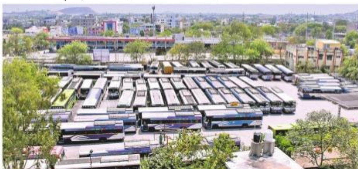
నల్గొండ డిపోలో నిలిచిపోయిన బస్సులు