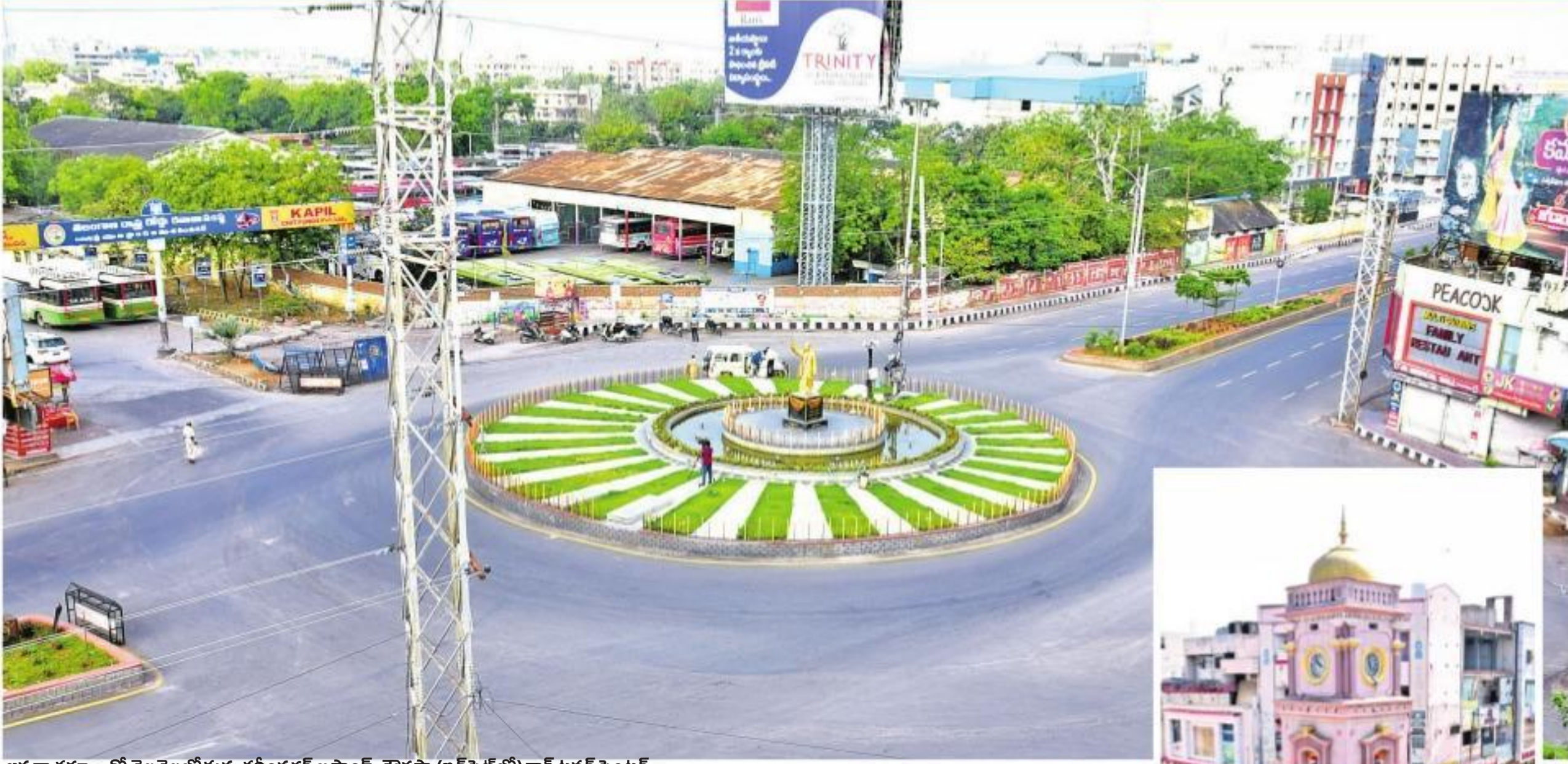
జనతా కర్పూపుతో వెలవెలపోతున్న కరీంనగర్ బస్టాండ్ చౌరస్తా (ఇన్సెట్లో) క్లాక్ టవర్ సెంటర్