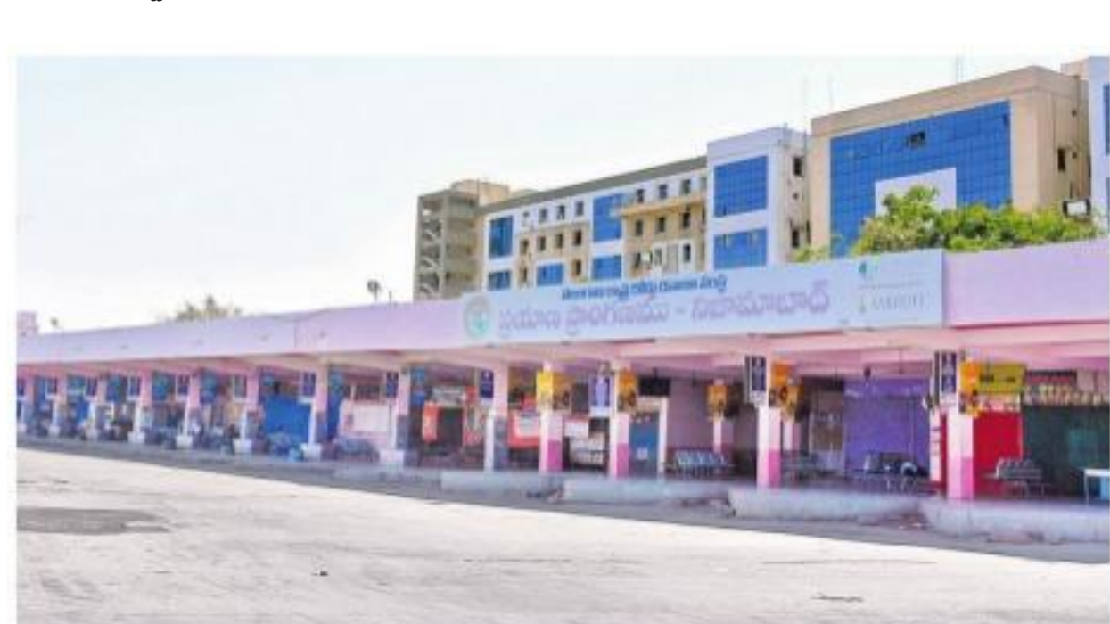
ప్రయాణికులు లేక ఖాళీగా ఉన్న నిజామాబాద్ బస్టాండ్