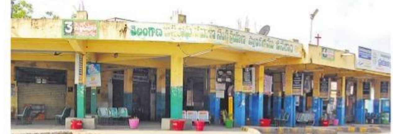
నిర్మాణం ద్వారా మారిన జనగామ బస్టాండ్