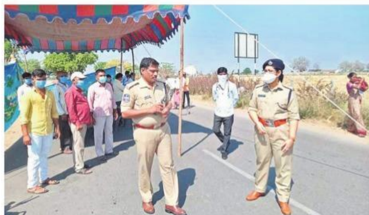
కృష్ణ మండలం త్రైరోడ్ చెక్ పోస్టును పరిశీలిస్తున్న ఎస్సీ చేతన