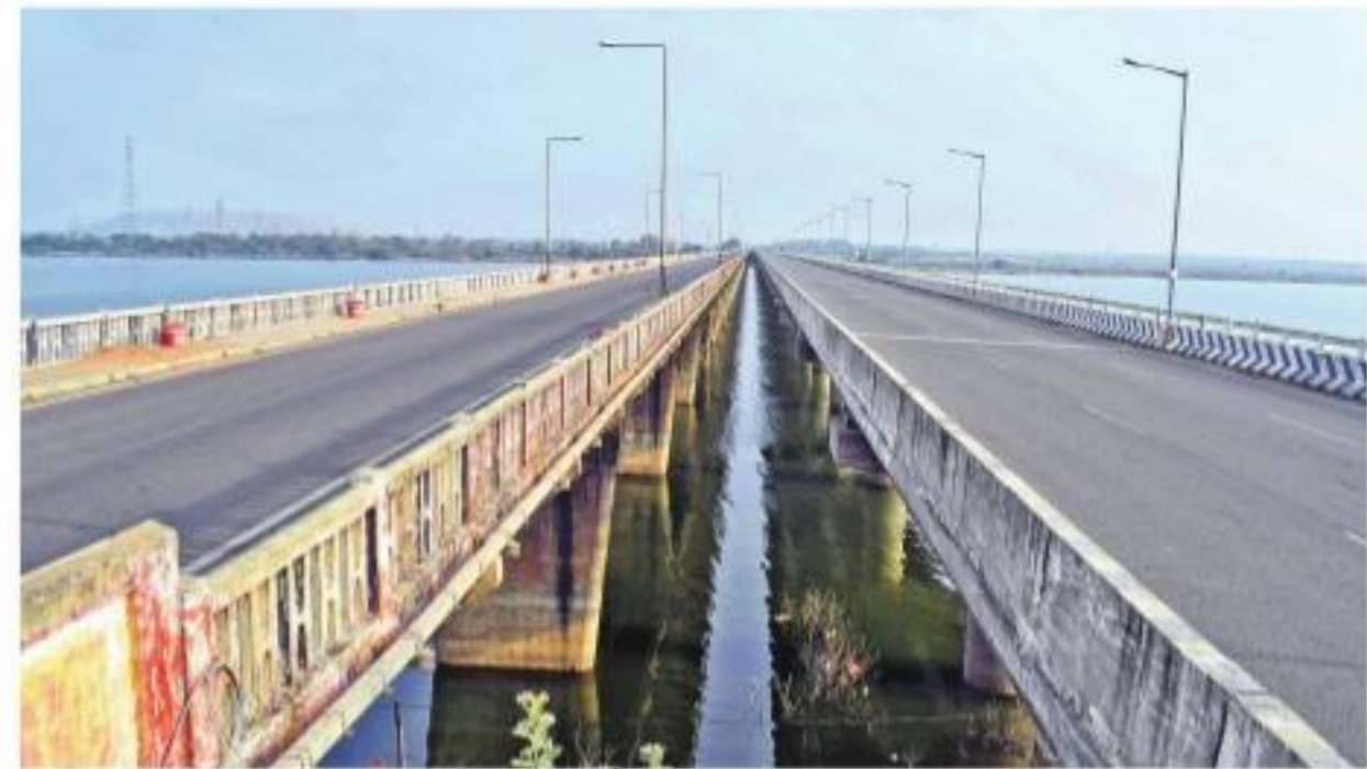
పెద్దపల్లి మండలాల మధ్య ఖాళీగా కనిపిస్తున్న గోదావరి బ్రిడ్జి