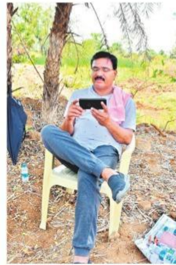
వనపర్తి: వ్యవసాయ క్షేత్రంలో మంత్రి నిరంజన్ రెడ్డి