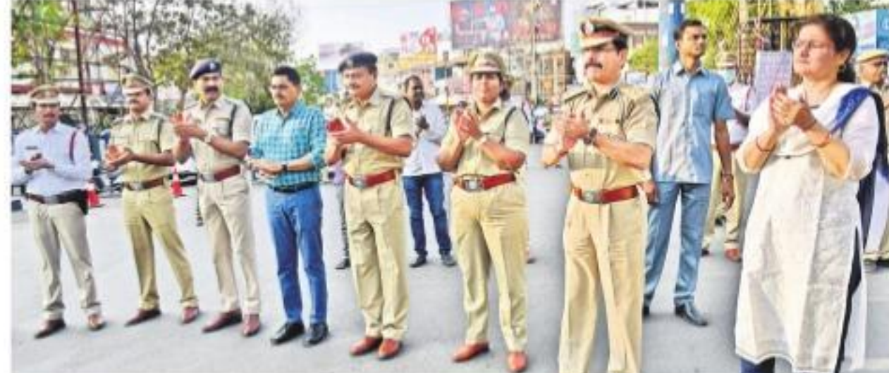
డాక్టర్లకు కృతజ్ఞతగా చప్పట్లు కొడుతున్న సీఎంపీ దంపతులు, పోలీసులు