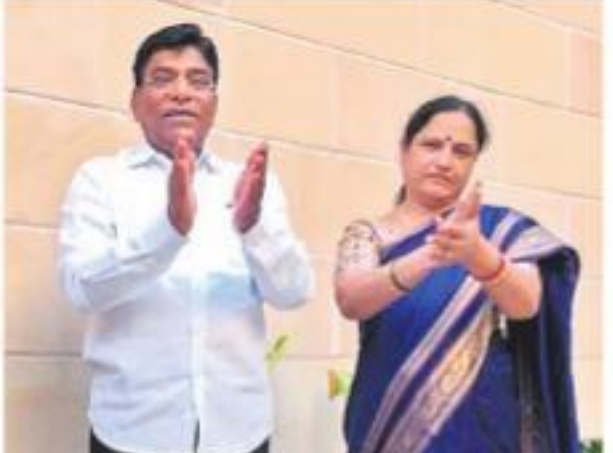
ఢిల్లీలో డాక్టర్లకు సంఘీభావంగా చప్పట్లు కొడుతున్న ఎంపీ నామా దంపతులు