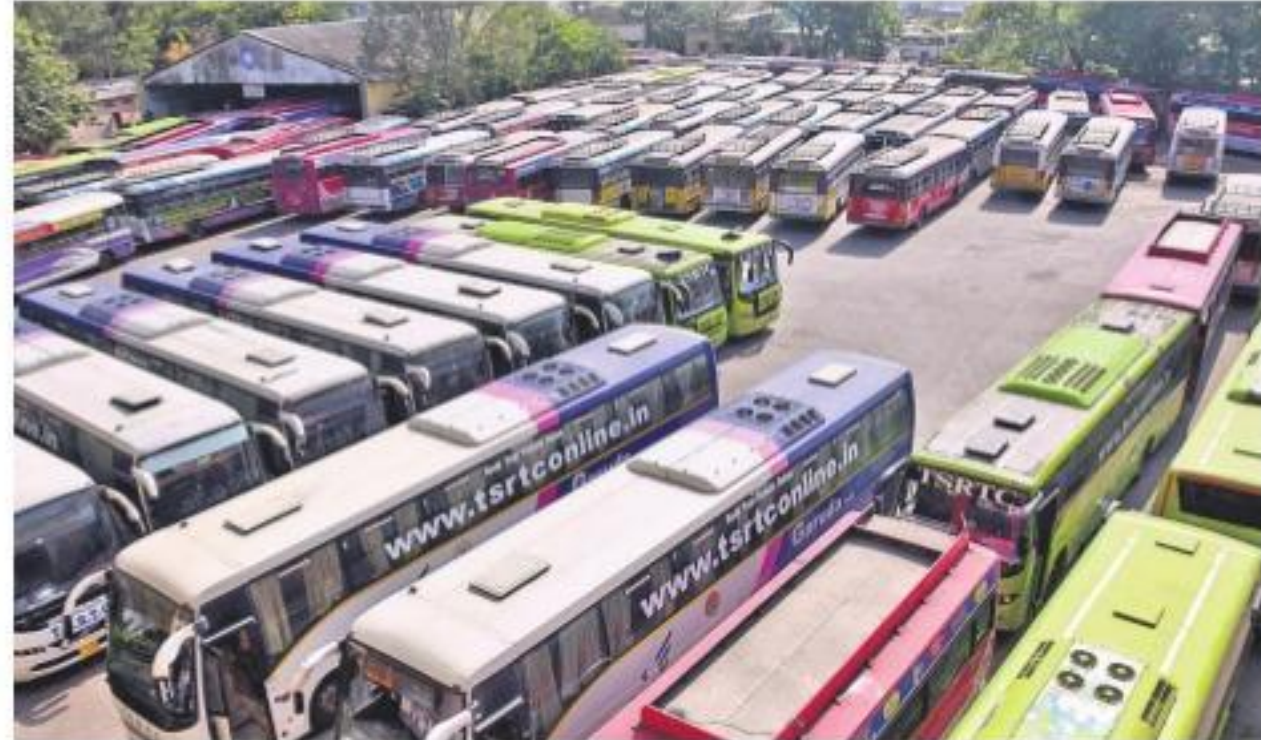
హన్మకొండలోని ఆర్టీసీ డిపోలో నిలిపిన బస్సులు