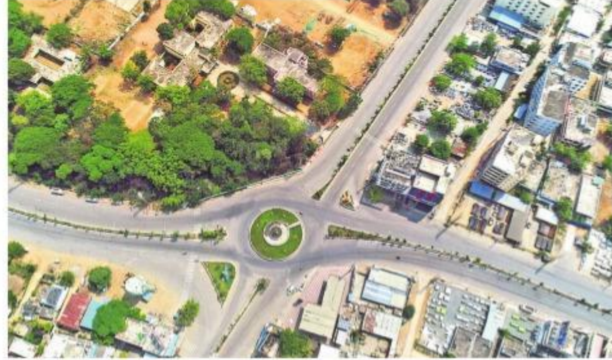
ఖమ్మంలోని ఎన్టీఆర్ సర్కిల్ వద్ద...