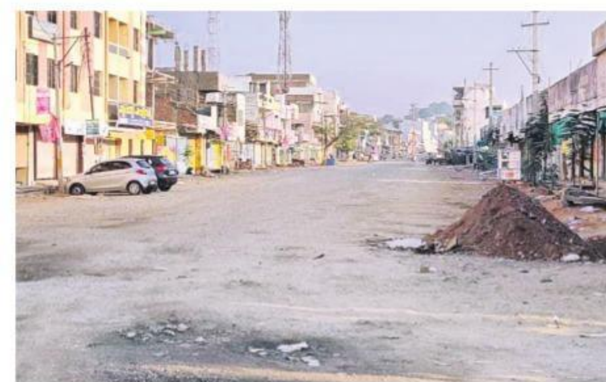
నారాయణపేట జిల్లా కేంద్రంలో నిర్మాణమయంగా ఉన్న ప్రధాన రోడ్