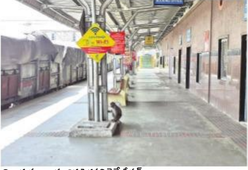
నిర్మాణానికి మారిన పెద్దపల్లి రైల్వే స్టేషన్