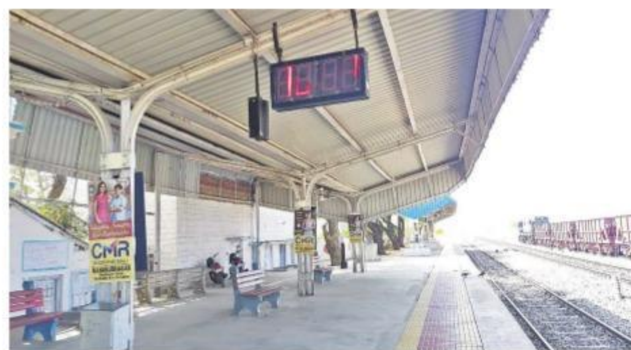
ప్రయాణికులు లేక వెలవెలతోతున్న దేవరకర్త రైల్వే స్టేషన్