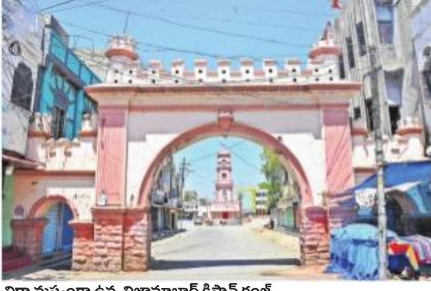
నిర్మాణానికి ఉన్న నిజామాబాద్ కిసాన్ గంజ్