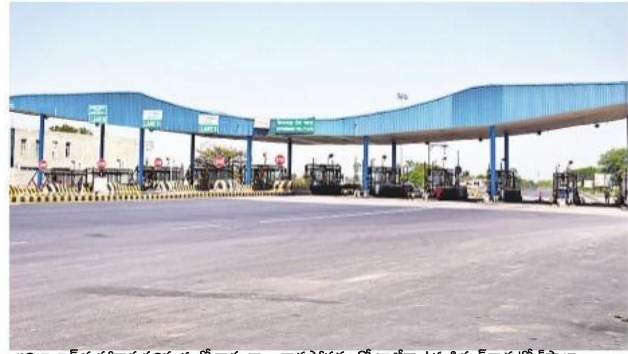
అదిలాబాద్ మహారాష్ట్ర సరిహద్దులో వాహనాలు రాకపోవడంతో ఖాళీగా ఉన్న పిప్పర్ వాడ టోల్ ప్లాజా