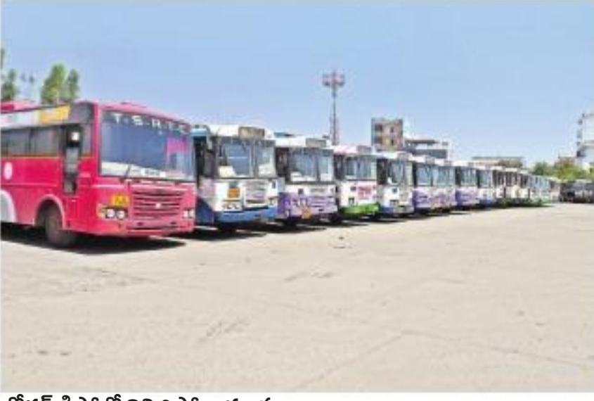
బోధన్ డిపోలో నిలిచిపోయిన బస్సులు