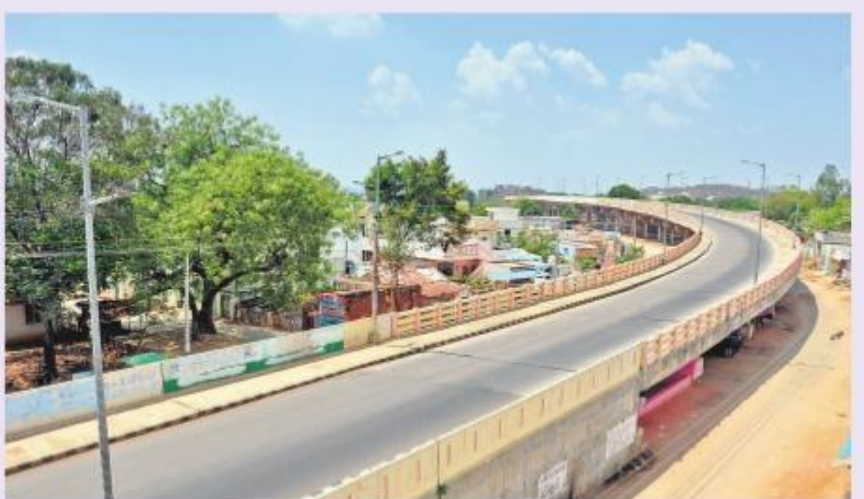
మహబూబ్ నగర్: అప్పన్నపల్లి దగ్గర నిర్మాణమయంగా ఉన్న హైవే