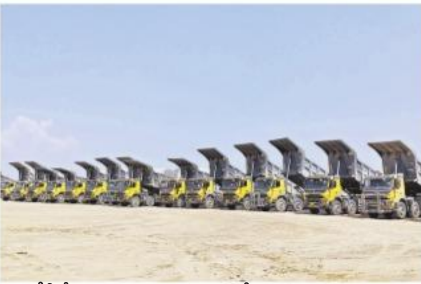
సింగరేణిలో బొగ్గు ఉత్పత్తి జరగకపోవడంతో నిలిచిపోయిన డంపర్లు