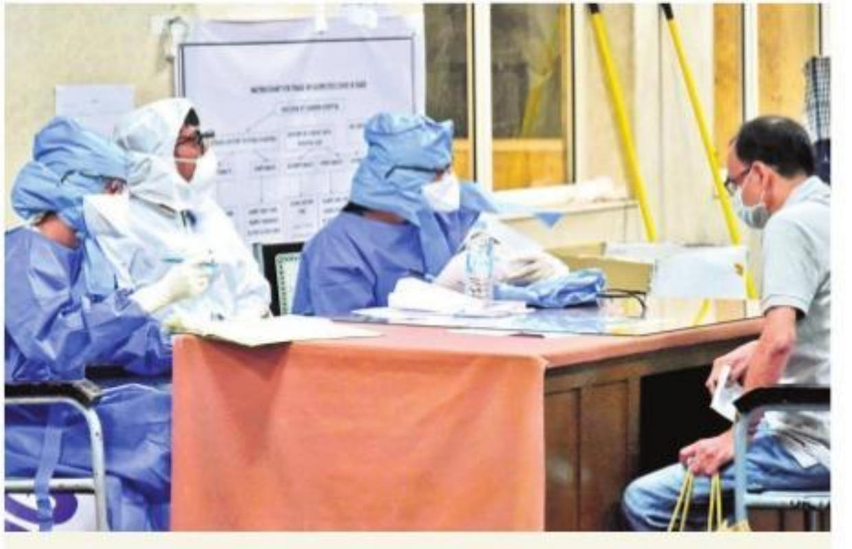
ఆ ఆరుగురు ఎవరు?

హైదరాబాద్, వెలుగు: రాష్ట్రంలో కరోనా వైరస్ కేసుల సంఖ్య రోజు రోజుకూ పెరుగుతోంది. ఆదివారం ఒక్క రోజే ఆరు పాజిటివ్ కేసులు నమోదయ్యాయి.