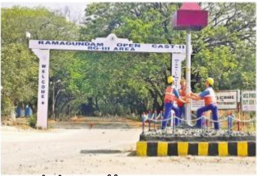
కార్మికులు లేక బోసిపోయిన ఓసీపీ-2 ముఖద్వారం