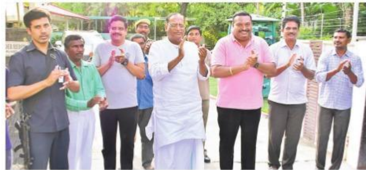
నల్గొండలో చప్పట్లు కొడుతున్న శాసనసభంధి చైర్మన్ గుత్తా సుఖేందర్ రెడ్డి