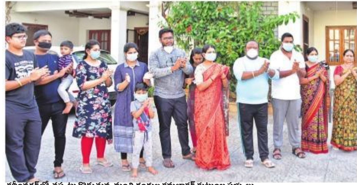
కరీంనగర్లో చప్పట్లు కొడుతున్న మంత్రి గంగుల కమలాకర్ కుటుంబ సభ్యులు