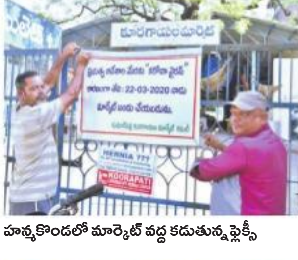
హన్మకొండలో మార్కెట్ వద్ద కడుతున్న షిక్కి