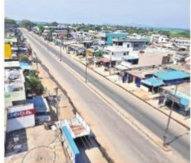
నిర్మాణం వల్ల వేట మెయిన్ రోడ్డు