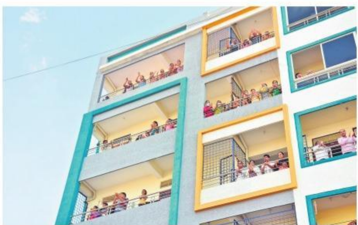
మహబూబ్ నగర్: వెంకటేశ్వర కాలనీలోని వందల అపార్ట్ మెంట్ లో చప్పట్లు కొడుతున్న జనాలు