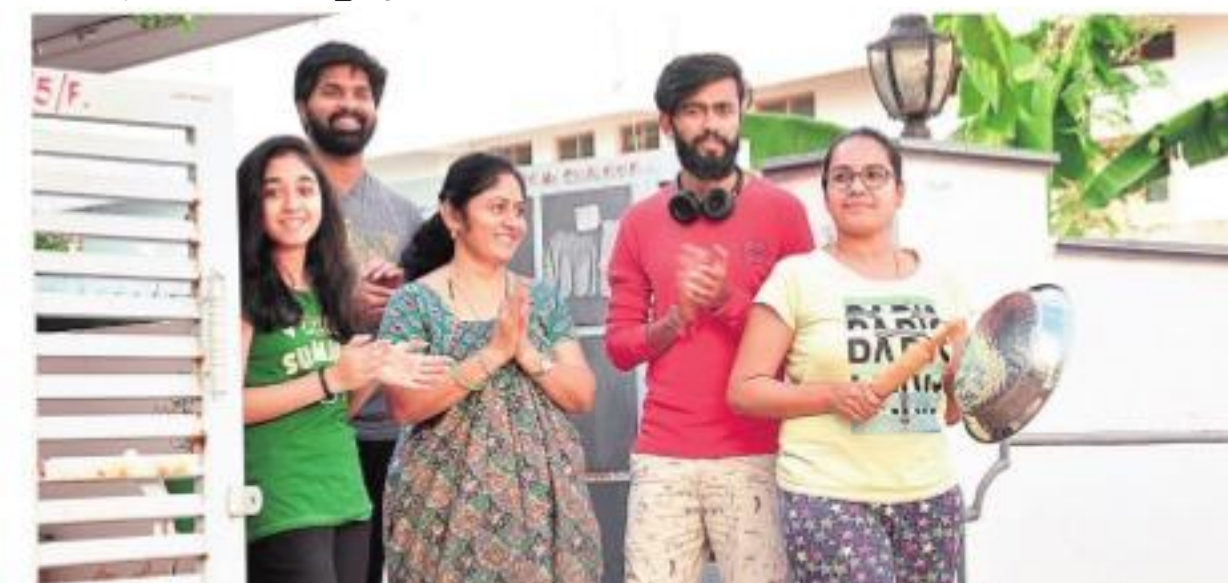
మహబూబ్ నగర్ లో చప్పట్లు కొడుతున్న ఓ కుటుంబం