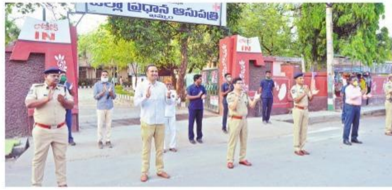
జిల్లా ఆస్పత్రి ముందు చప్పట్లు కొడుతున్న కలెక్టర్ కర్ణం, సీఎం తప్పేర్ ఇక్బాల్, ఇతర పోలీస్ సిబ్బంది