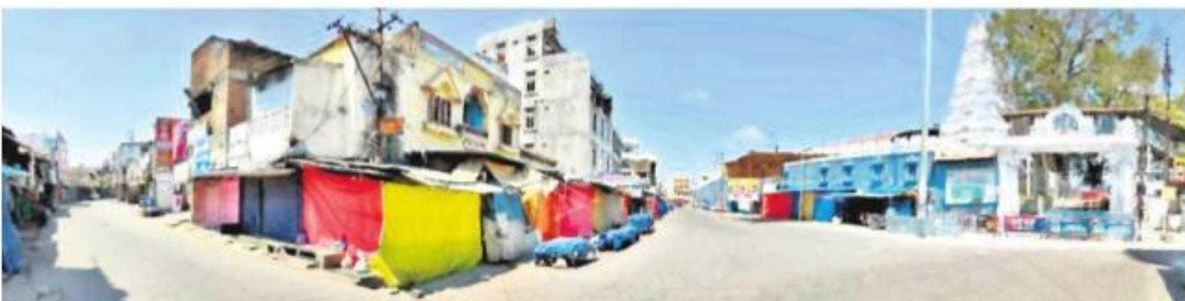
బోసిపోయిన వేములవాడ ఆలయ పరిసరాలు