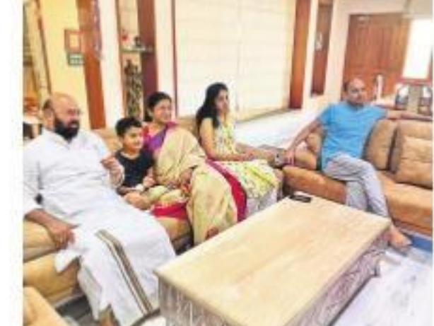
కుటుంబ సభ్యులతో జనగామ ఎమ్మెల్యే ముత్తైరెడ్డి