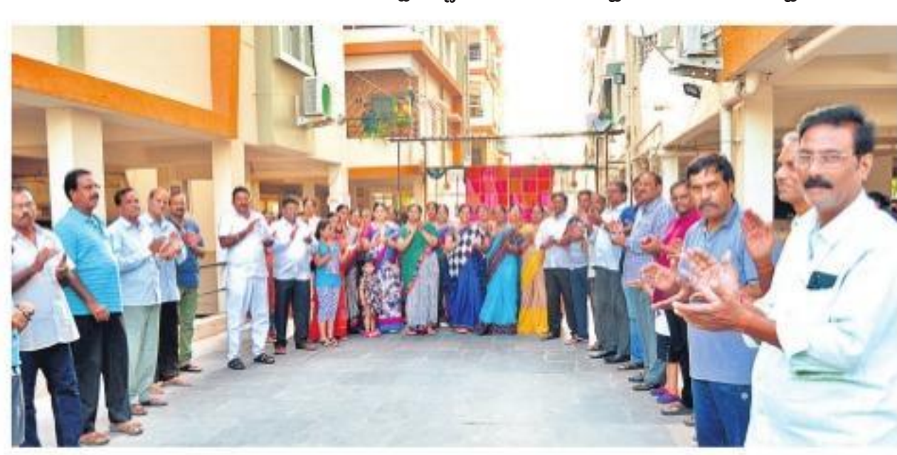
ఖమ్మంలో చప్పట్లు కొడుతున్న పెద్దలు, పిల్లలు