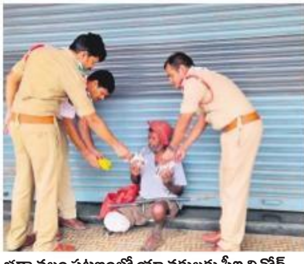
భద్రాచలం పట్టణంలో యాచకులకు సీఎంపీ ఆధ్వర్యంలో ఆహార పాత్రాలను అందజేస్తున్న పోలీసులు