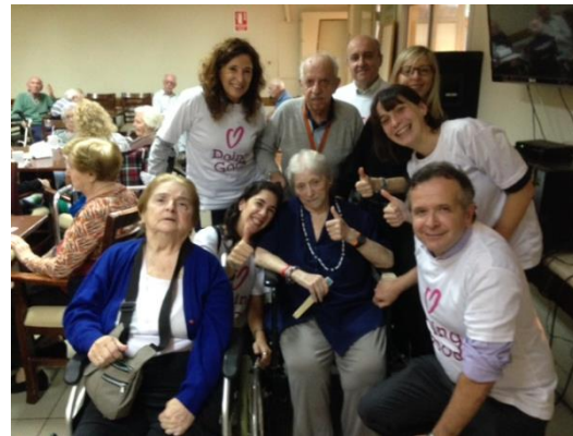
Arte y Artesanías con Adultos Mayores - BHI, Uruguay