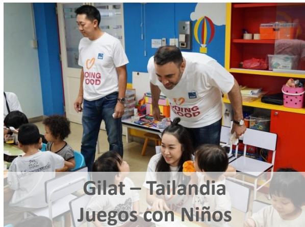
Gilat – Tailandia Juegos con Niños