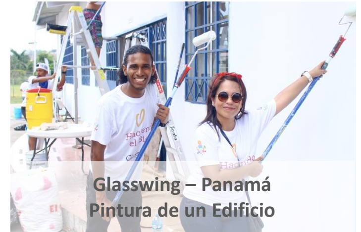
Glasswing – Panamá Pintura de un Edificio