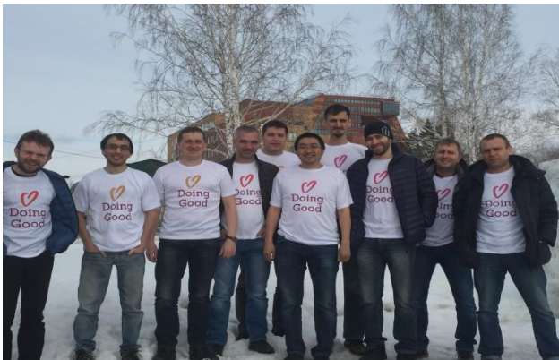
Ayuda en un Refugio de Animales PeerApp, Russia

Ejemplos de proyectos de Empresas en diferentes partes del mundo en el Día de las Buenas Acciones