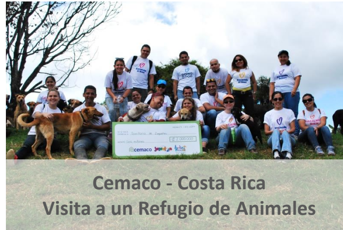
Cemaco - Costa Rica Visita a un Refugio de Animales