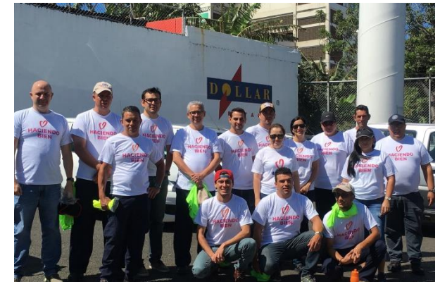
Limpieza de un Parque Dollar Rent A Car, Costa Rica