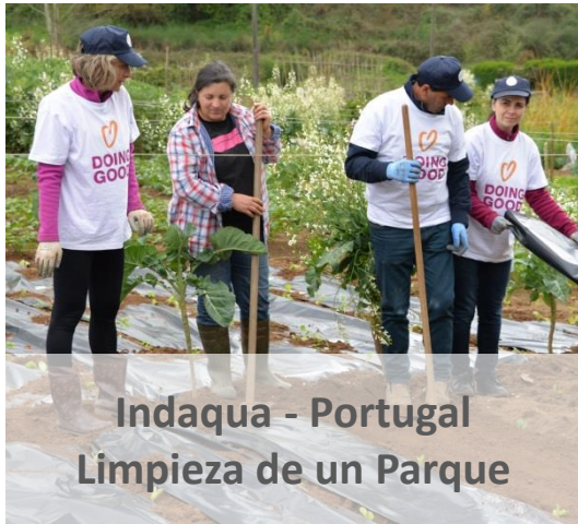
Indaquia - Portugal Limpieza de un Parque