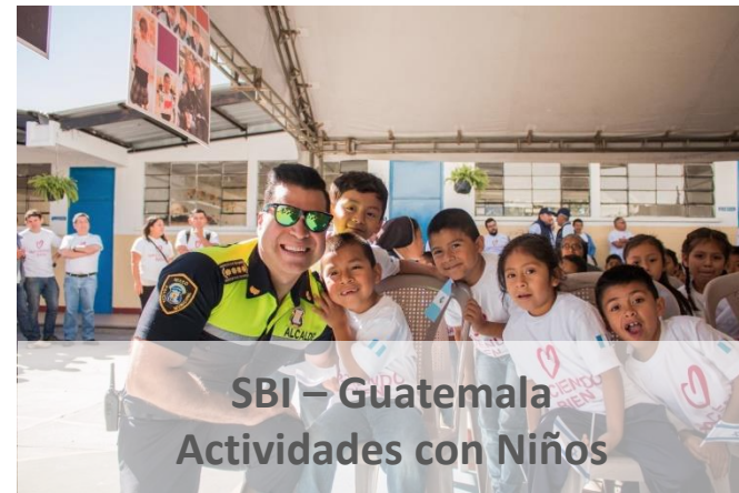
SBI – Guatemala Actividades con Niños