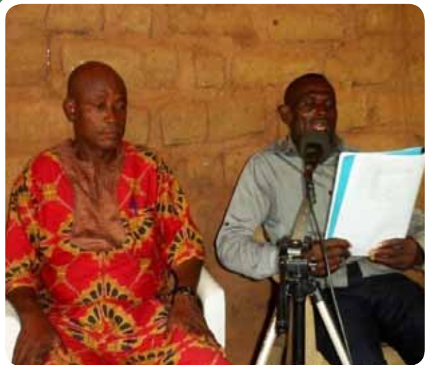
Puji Tuhan 1 rekaman dibuat untuk Kukele