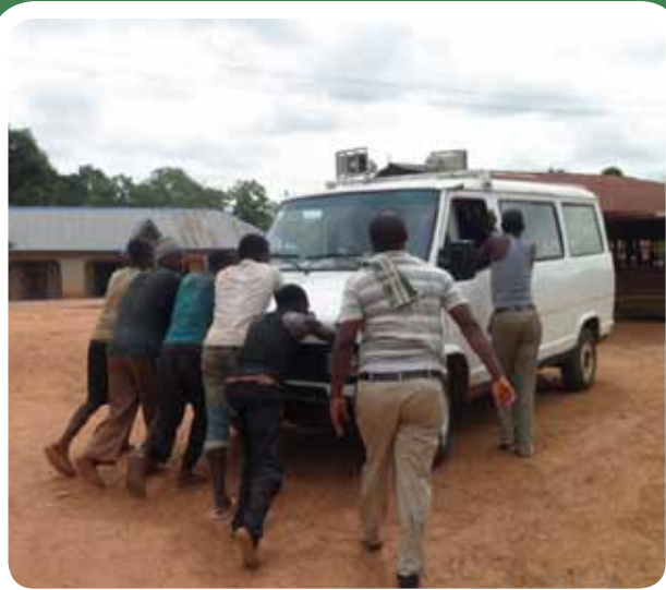
Tim mengalami beberapa kerusakan kendaraan