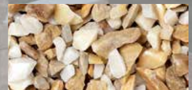
Giallo Siena (nur in 8-12 mm und 16-22 mm)