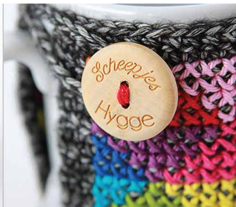
Mok cozy (bonus patroon)