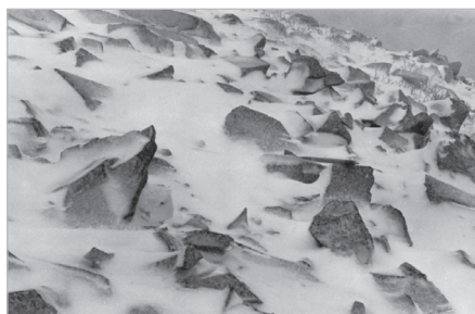
Les types de glace et de neige, la morphologie du territoire et les saisons font partie des objets de recherche de Louis-Edmond Hamelin. Ici, champ de cailloux enneigés au sommet du mont Sainte-Anne en fin de septembre 1965.

Numéro 001-6-11-361, Collection Louis-Edmond Hamelin.