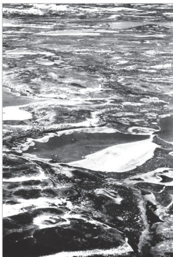
Photographie prise par Louis-Edmond Hamelin en septembre 1972, survolant le paysage enneigé et gelé de la région du lac Coiffier, au nord-est de Schefferville, au début de l'hiver.

Numéro 001-6-2-355, Collection Louis-Edmond Hamelin.