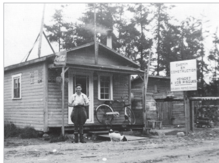
Photographie de la première barrière de la route entre Saint-Félicien et Chibougamau, dans le Moyen Nord québécois, en 1949.

Numéro 001-6-3-451, Collection Louis-Edmond Hamelin.