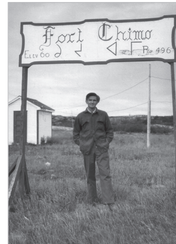
à Fort Chimo, l'ancien site du village inuit de Kuujuaq sur la rive droite, à l'été 1955.

Numéro 001-6-2-426.