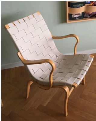
Bild 2. Bruno Mathsson, Eva 1941