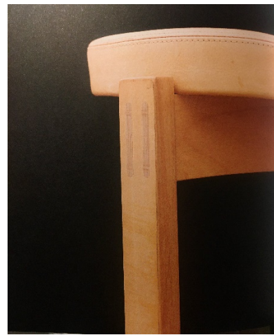
Bild 5. Detalj stol Wood 2009, Axelsson Bild 6. Detalj stol Nymans, 2013, Axelsson Bild 7. Detalj stol S217, 1963, Axelsson

Jag ställde frågan vad ger en inredning ett långsiktigt värde hur kan den bevaras? Ekholm säger att i den offentliga miljön har möbler valts med en hög teknisk kvalitet för att klara slitage. Även Johansson-Hellström beskriver Regeringskansliets möbelbestånd från bland annat 1970-80-talet, som möbler med hög komfort, god ergonomi och hållbarhet över tid. Johansson-Hellström beskriver som Ekholm att värdet på konstruktion och teknisk utformning är viktig, att den består av synliga delar som kan demonteras och att ”stolen då lätt kan renoveras och återanvändas.” Det i sin tur gör den till en hållbar produkt. Både Ekholm och Eidsaunet uttrycker att det även finns ett värde i att ge ny inredning en årsring av äldre produkter. ”De ger dagens moderna inredningar en extra dimension av en berikande kulturhistorisk tidsresa”, säger Ekholm. 93