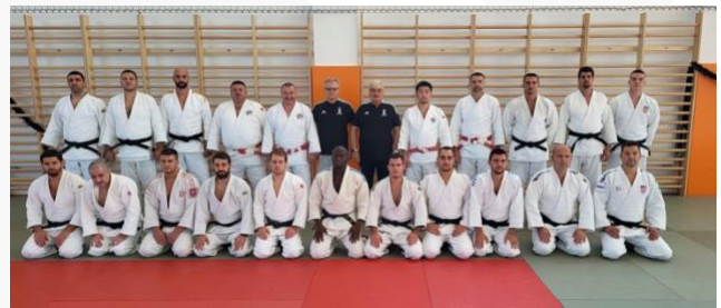
Hungría – UCJI/Nivel 1 – septiembre de 2022