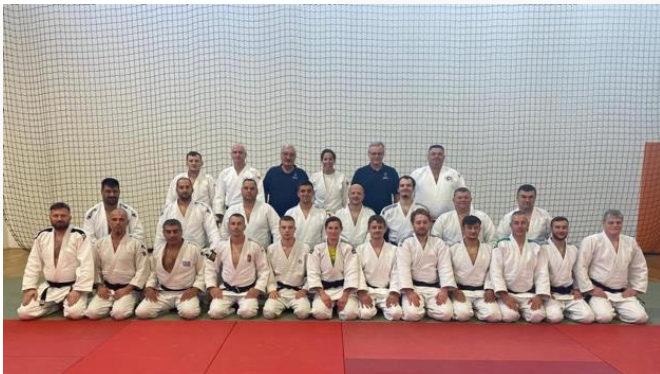
Hungría – UCJI/Nivel 1 – noviembre de 2021