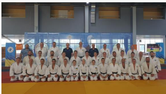
Ucrania – Nivel 2 – agosto de 2021