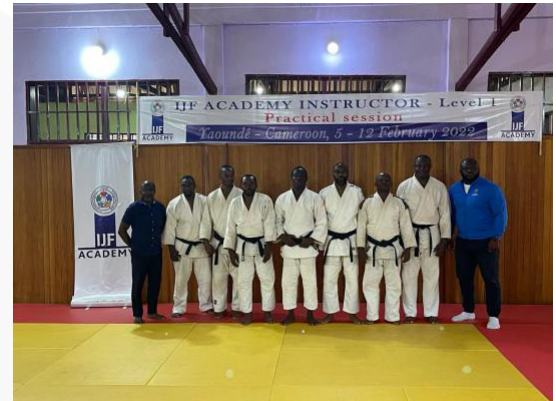
Camerún – Nivel 1 – febrero de 2022