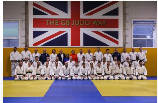
Reino Unido – UCJI/Nivel 1 – agosto de 2022