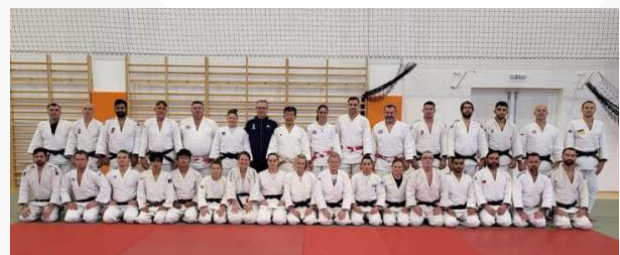
Hungría – UCJI/Nivel 1 – diciembre de 2022