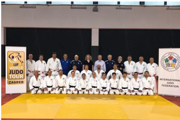
Croacia – Arbitraje NK – julio de 2022