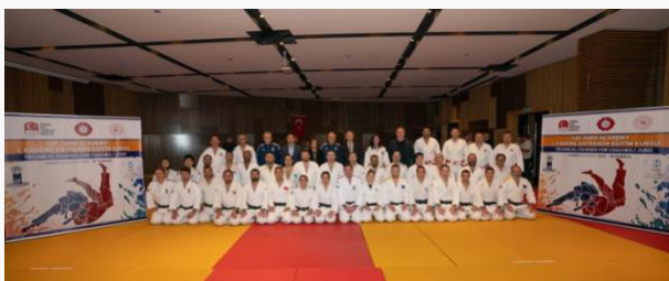
Turquía – UCJI/Nivel 1 – noviembre de 2022