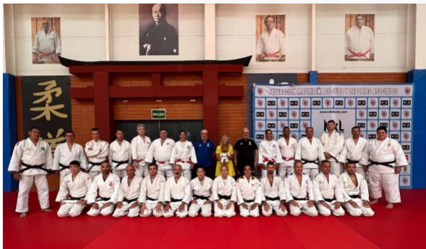
España – UCJI/Nivel 1 – agosto de 2022