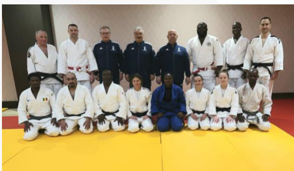
Turquía – Nivel 2 – marzo de 2022