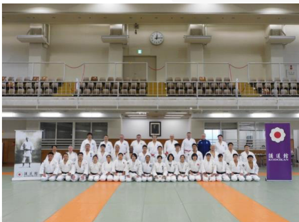
Japón – UCJI/Nivel 1 – noviembre de 2022