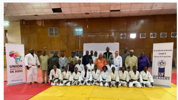
Níger – Nivel 1 – abril de 2022