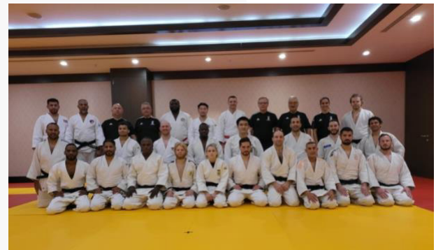
Turquía – Nivel 1 – marzo de 2022