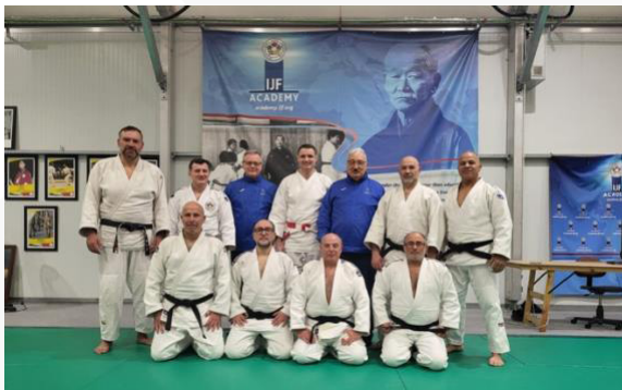
Malte – Nivel 2 – febrero de 2022