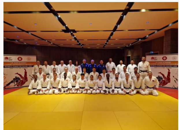
Turquía – UCJI/Nivel 1 – noviembre de 2022