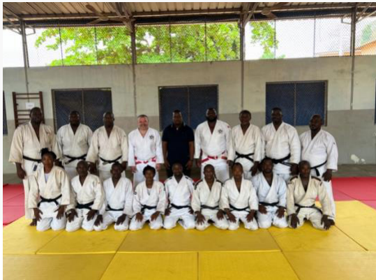
Benín – Nivel 2 – febrero de 2022