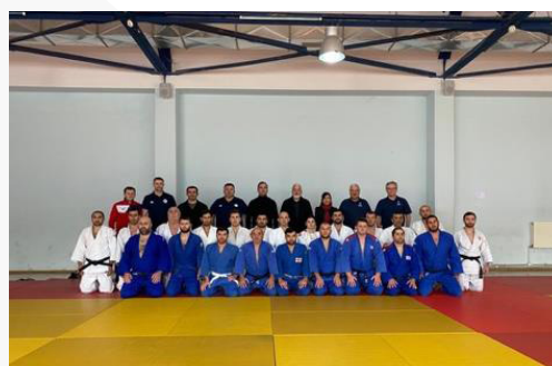
Georgia – Nivel 1 – noviembre de 2021