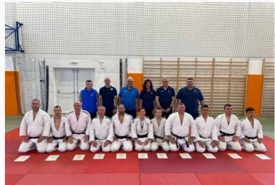
Hungría – UCJI/Nivel 1 – diciembre de 2021