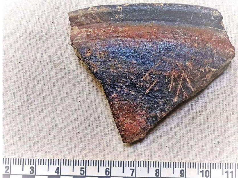
நாங்கூரில் கிடைக்கப்பெற்ற கோட்டுவடிவ மீன் குறியீடு