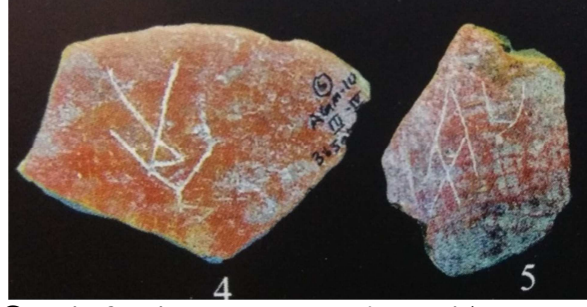
நன்றி : தமிழகத் தொல்லியல்துறை, அழகன்குளம்(இராமநாதபுரம் மாவட்டம்) (K.Rajan, Early Writing System-A journey from Graffiti to Brahmi: 2015 )

திருநெல்வேலி மாவட்டம் ஆதிச்சநல்லூரில் நிகழ்ந்த அகழாய்விலும் பாணையோட்டுப் பொறிப்புகளில் கோட்டுவடிவ மீன்குறியீடுகள் கிடைத்துள்ளன. இங்குக் கிடைக்கப்பெற்ற மீன்குறியீடுகள் அனைத்தும் கீறல்முறையில் அமைந்த நேர்கோட்டு வடிவிலானவை. வடிவ ஒப்புமையில் சிந்துவெளிக் குறியீட்டு வடிவங்களை ஒத்ததாக இவை அமைகின்றன.