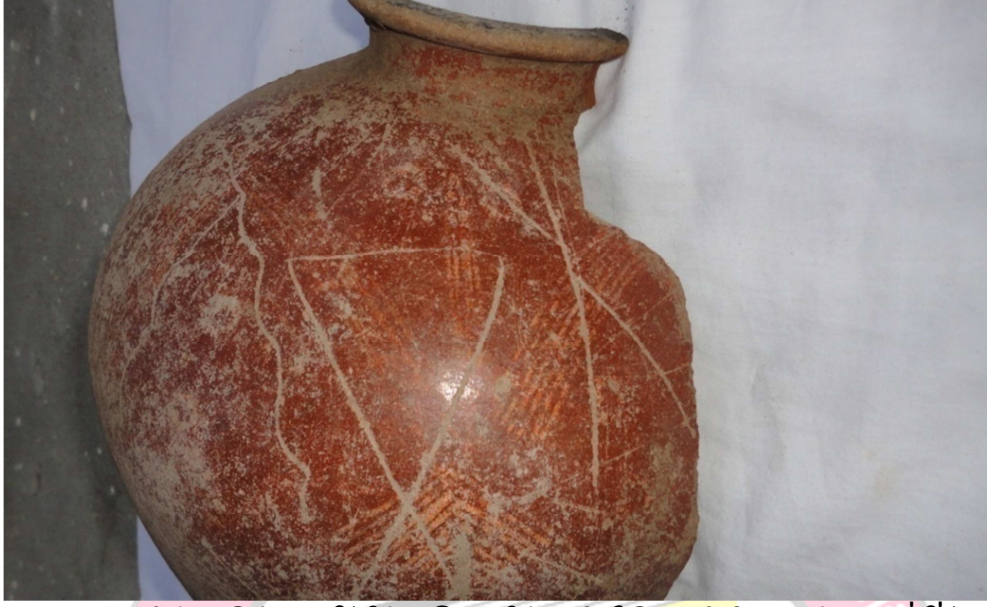
பாணையின் நடுப்பகுதி(சிந்துவெளிக்குறியீடு, தமிழ் எழுத்தான 'தி')

பாணையின் அடிப்பகுதியில் இரு குறியீடுகள் காணப்பெறுகின்றன. முதல் குறியீடு கோட்டுவடிவ மீன்குறியீடாகவும் இரண்டாவது குறியீடு மீனின் நடுப்பகுதி முள் போன்றும் அமைந்துள்ளது. மீனின் முள் போன்ற குறியீட்டின் மீது கோட்டுவடிவ மீன்குறியீடு கீறல்முறையில் அமைந்துள்ளது. இவ்விரு குறியீடுகளும் உலகின் பல்வேறு பகுதிகளில் காணப்பெறும் குறியீடுகளோடு பொருந்தி அமைகின்றன. நார்டிக் மொழியின் தொல்குறியீட்டு வடிவம் (Ancient Nordic language), சுவீடன் நாட்டுப் பாறை ஓவியக்குறியீடுகள் (kylver Rune stone, sweden), சுமேரியர்களின் கியூனிஃபார்ம் எழுத்துமுறை (sumerian cuniform) ஆகியனவற்றோடு தொடர்புடையதாக அமைகின்றது. (காண்க: பெருங்கற்காலத் தமிழ்ச்சமுதாயம் கீழிருந்து மேலெழும் வரலாறு : 2019).