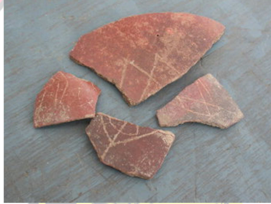
நன்றி : தமிழகத் தொல்லியல் துறை வெளியீடு.

திருநெல்வேலி மாவட்டம் ஆதிச்சநல்லூரில் நிகழ்ந்த அகழாய்விலும் பாணையோட்டுப் பொறிப்புகளில் கோட்டுவடிவ மீன்குறியீடுகள் கிடைத்துள்ளன. இங்குக் கிடைக்கப்பெற்ற மீன்குறியீடுகள் அனைத்தும் கீறல்முறையில் அமைந்த நேர்கோட்டு வடிவிலானவை. வடிவ ஒப்புமையில் சிந்துவெளிக் குறியீட்டு வடிவங்களை ஒத்ததாக இவை அமைகின்றன.