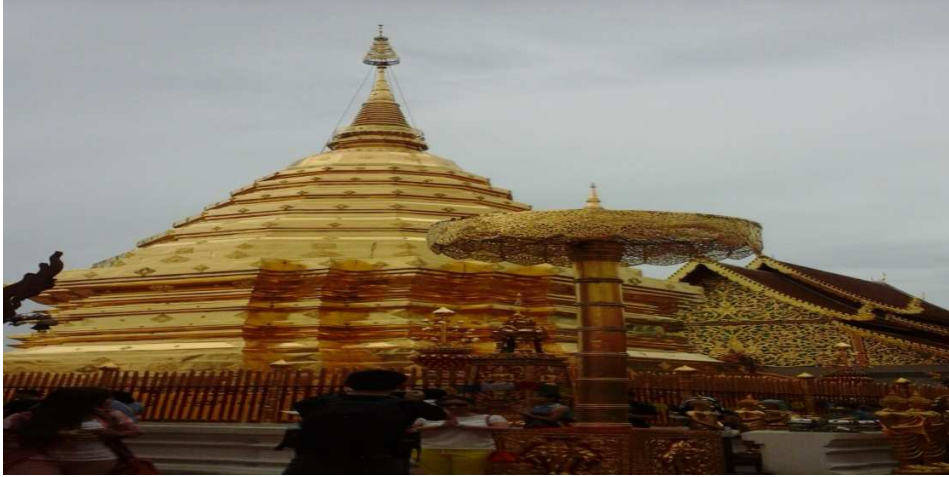
(படம்:10, 11 தங்கக் கோபுரம்)