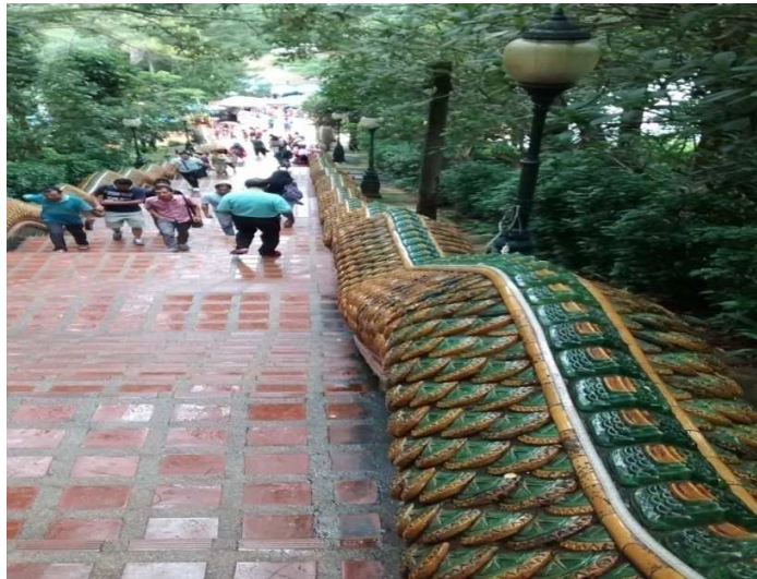
(படம்: 1, 2 வாட் டாய் சுதீப் கோயிலின் நாகவாசல் படிக்கட்டுகள்)