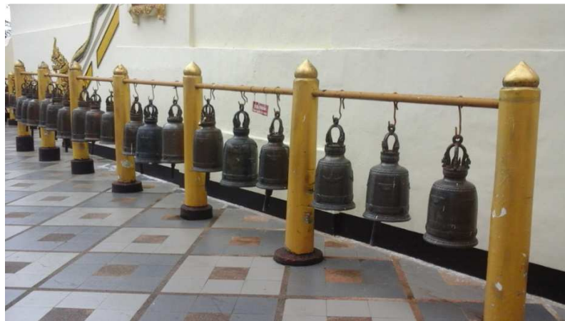
(படம்:4, 4.1.மணிமண்டபமும் மணிகளும்)