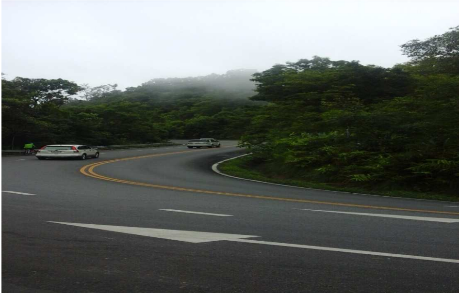
(படம்:13, 14 டாய் கோயிலுக்குச் செல்லும் பாதை)

இதற்கு முன்புவரை, ஒரு வரையறுக்கப்பட்ட சாலை வசதி இல்லாமல் காட்டுவழிப் பயணமாகவே மக்கள் நடந்து சென்று வழிபட்டு வந்தனர்.