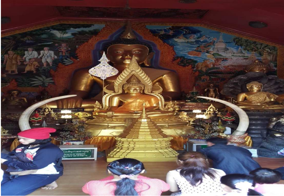
(படம்:9 கோயிலின் சுவர் ஓவியம்)

அடுத்த தளத்திற்குச் செல்லும்போது அங்கே பெரிய, சிறிய கோயில்கள் அமைந்துள்ளன. அதில் புத்தர் சிலை அமைக்கப்பட்டுள்ளது. அந்த அறையில் பௌத்தத் துறவிகள் மந்திரங்களையும், மதபோதனைகளையும் மக்களுக்கு வழங்கிக் கொண்டு இருப்பார்கள். அதன் சுவர்களில் புத்தரின் வாழ்வினைச் சித்திரிக்கும் வகையில் நாற்பத்தியேழு சுவர் ஓவியங்கள் தீட்டப்பட்டுள்ளன. முக்கியமாக, புத்தரின் ஆரம்ப வாழ்க்கையையும் முக்தி நிலைகளையும் (Nirvana) சித்திரிக்கும் வகையில் அவை அமைந்திருக்கின்றன.