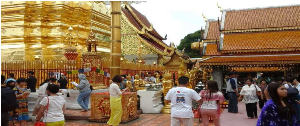
(படம்:12 சுற்றுப்பாதை – தங்கக் கோபுரம்)