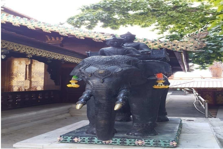
(படம்:7 அரசன் குயினாவின் யானை)