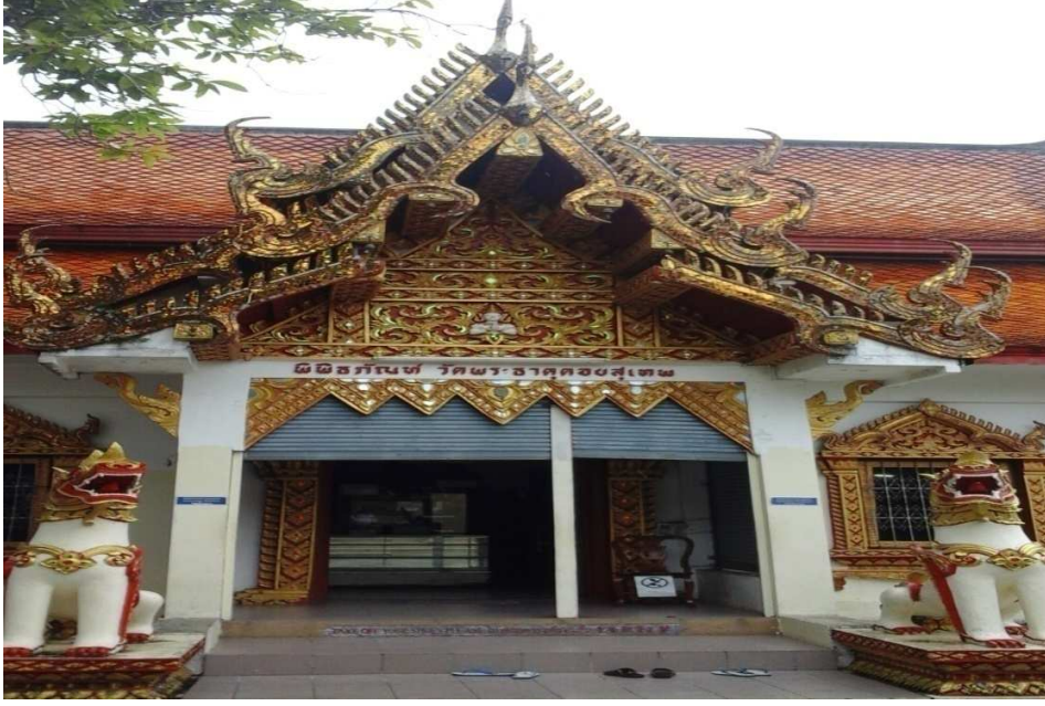
(படம்:8 பிரம்மாவின கோயில்)

அடுத்த தளத்திற்குச் செல்லும்போது அங்கே பெரிய, சிறிய கோயில்கள் அமைந்துள்ளன. அதில் புத்தர் சிலை அமைக்கப்பட்டுள்ளது. அந்த அறையில் பௌத்தத் துறவிகள் மந்திரங்களையும், மதபோதனைகளையும் மக்களுக்கு வழங்கிக் கொண்டு இருப்பார்கள். அதன் சுவர்களில் புத்தரின் வாழ்வினைச் சித்திரிக்கும் வகையில் நாற்பத்தியேழு சுவர் ஓவியங்கள் தீட்டப்பட்டுள்ளன. முக்கியமாக, புத்தரின் ஆரம்ப வாழ்க்கையையும் முக்தி நிலைகளையும் (Nirvana) சித்திரிக்கும் வகையில் அவை அமைந்திருக்கின்றன.