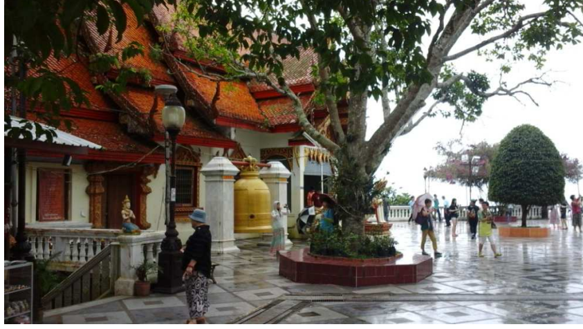
(படம்:5 போதி மரம்)