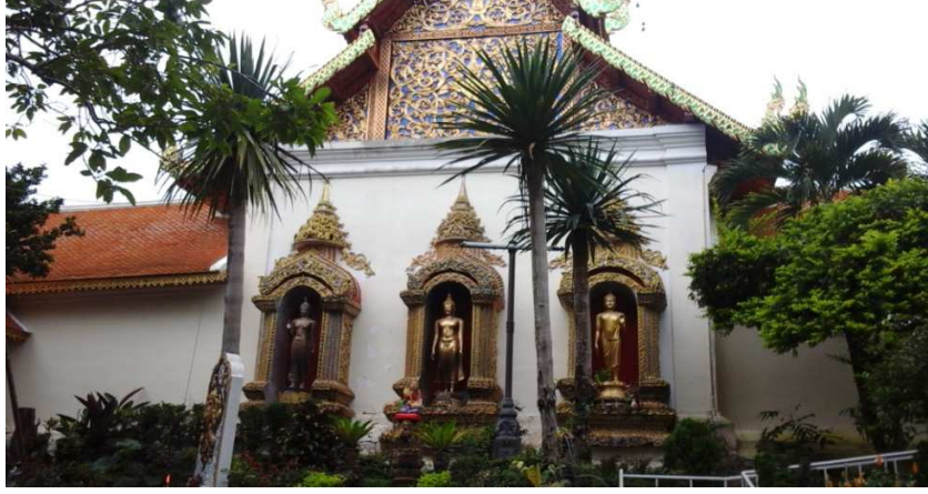
(படம்:3பௌத்தத் துறவியின் சிலை)

முதன்மை வாசலைக் கடந்து உள்ளே சென்றால், நம் வலப்பக்கமாகப் புத்தத் துறவி சூமணாவின் சிலை, இந்துக் கடவுளான பிரம்மாவின் சிலை, சிறிய மணி மண்டபம், இந்தியாவில் இருந்து கொண்டுவரப்பட்ட போதி மரம் போன்றவை அமைந்துள்ளன. மேலும், ஒரு வெள்ளையானையின் சிலையும், அரசன் குயினாவின் சிலையும் நிறுவப்பட்டுள்ளன.