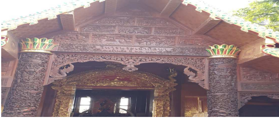
(படம்:6 அரசன் குயினாவின் கோயில்)