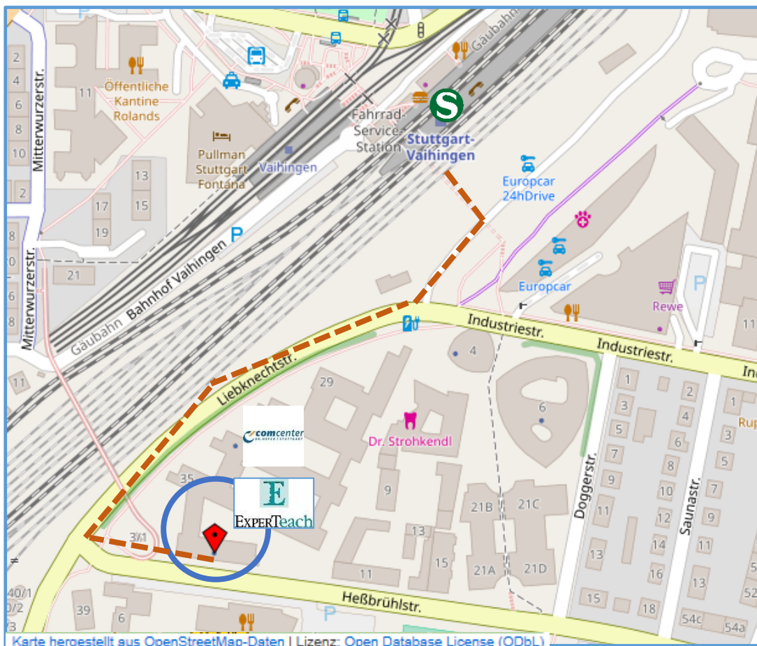
Karte hergestellt aus OpenStreetMap-Daten | Lizenz: Open Database License (ODbL)