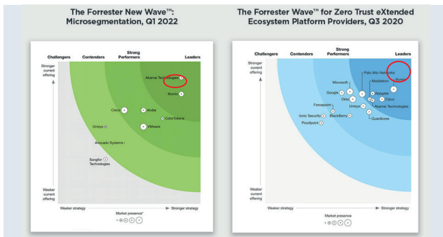
Abb. : Illumio Forrester Waves

Forrester hat Illumio in der Zero Trust Wave (ZTX) 2019 und 2020 zum Marktführer mit dem stärksten aktuellen Angebot und der besten Zukunftsvision ausgezeichnet. Illumio wurde in der 2022 neu erschienenen Forrester New Wave für Microsegmentation als einer der Marktführer ausgezeichnet.