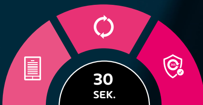
Abb.: Einfacher Onboarding-Prozess in drei Schritten

Mit 365 Total Protection schöpfen Sie das volle Potenzial Ihrer Microsoft Cloud Dienste aus.