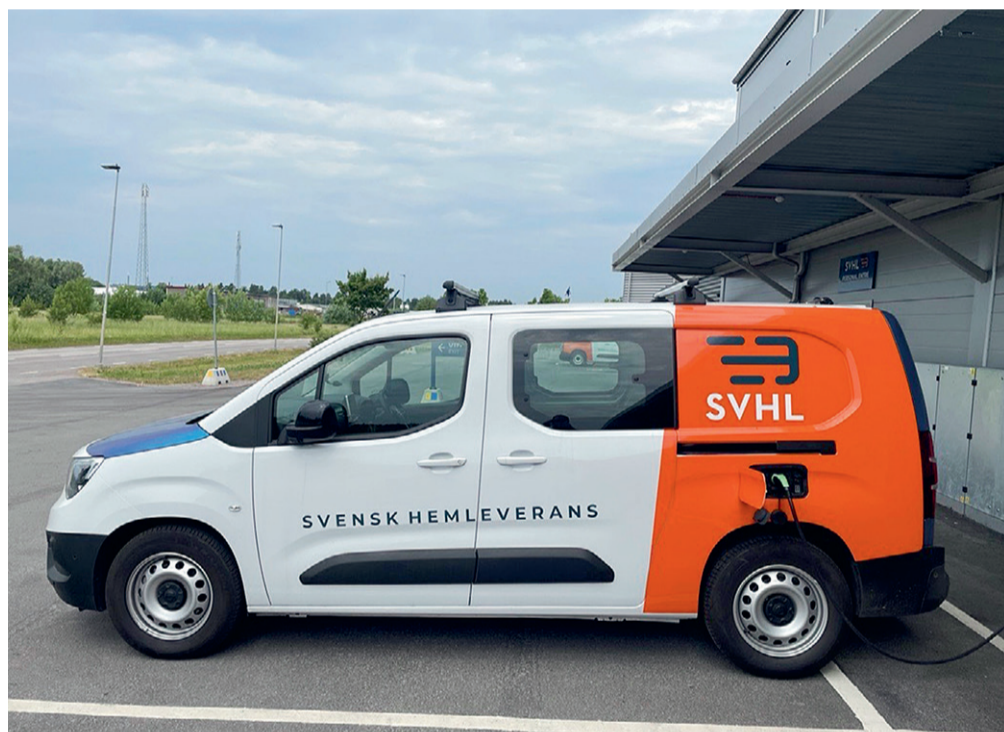
Tack vare VK Medias och NTM:s gemensamma distributionsföretag SVHL Norr KB, säkerställs en hållbar och effektiv tidnings- och pakettidningsdistribution, och genom elektrifiering av fordonsflottan minskas klimatavtrycket.