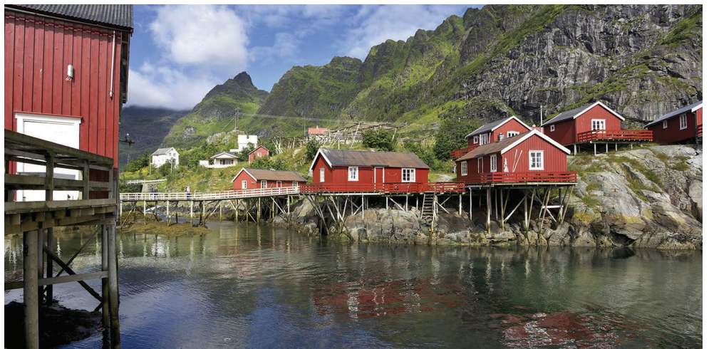
(De gauche à droite) : Le MS Polarlys, les salons, Lofoten