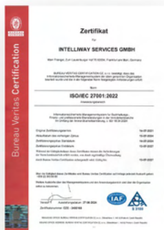
ISO 27001 (Informationssicherheits- Managementsysteme)