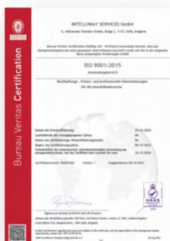
ISO 9001 (Qualitätsmanagement)