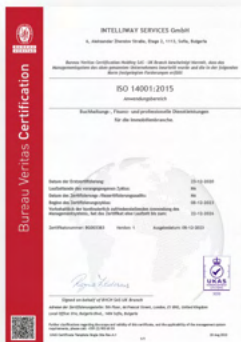
ISO 14001 (Umweltmanagement)